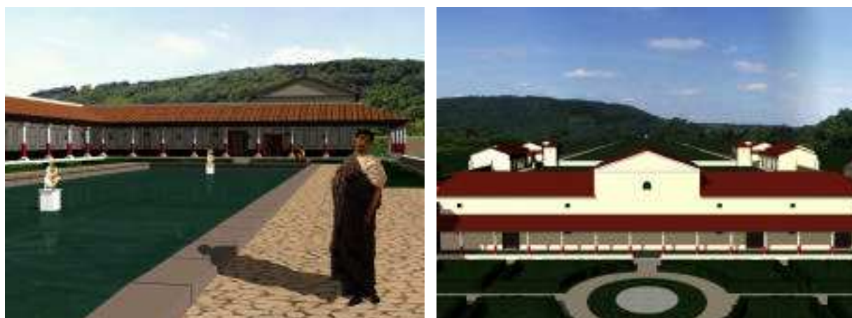
Fig. 10 et 11 : la villa et ses dépendances dans son site.

Pour les images détaillées en extérieur, la villa virtuelle devant être incrustée dans son site réel, une prise de vue photographique à 360° et retravaillée pour y faire disparaître tout élément contemporain (ainsi que tous les arbres résineux absents au premier siècle) a été élaborée (Fig. 10 et 11)