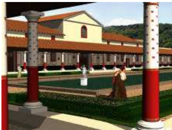
Fig. 6 et 7 : Façade sur cour et façade « arrière » du bâtiment central.

Une première série d'images montrant les différents corps de bâtiments et la manière avec laquelle il composent l'édifice d'origine a été produite (Fig. 6 et 7), se poursuivant avec l'adjonction de bâtiments supplémentaires lors de la deuxième période de construction au début du 2 e siècle. Certaines de ces images ont été calculées depuis un point de vue virtuel identique à celui d'un observateur situé devant le panneau sur lequel est imprimée l'image, lui permettant d'imaginer la volumétrie du bâtiment en fonction des restes devant lesquels il se trouve.