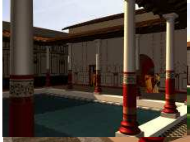
Fig 4 et 5 : Hypothèses de restitution du triclium

Il est à noter également que les nombreuses rencontres inter-disciplinaires (archéologues-architectes-infographistes) furent le lieu privilégié des réactions et nouveaux questionnements : les images en cours d'élaboration sont un facteur « déclencheur » indéniable pour l'archéologue. Il réagit sur la nature et l'aspect des matériaux, la conformation des éléments architecturaux, les proportions ou encore les procédés constructifs qui sont de facto mieux cernés, la visualisation tridimensionnelle met en évidence des points habituellement laissés dans l'ombre. C'est principalement pour cette raison que la phase de reconstitution proprement dite est plus porteuse d'avancées dans la connaissance archéologique du bâtiment ou du site que les résultats visuels qui en sont tirés.