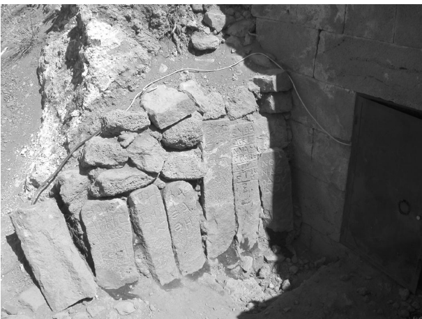
Fig. 2. Stèles inscrites 1-6 et stèle anépigraphue non numérotée (de droite à gauche)

(Fig. 3). Les stèles n os 1, 2, 3, 4, 6 et 7 sont inscrites en grec, tandis que les stèles n os 5, 8 et 11 portent chacune une inscription nabatéenne. La stèle n o 9, anépigraphue, est ornée d'une tête humaine de face au-dessus d'un méandre. Le bloc n o 10, brisé dans sa partie inférieure, porte un dessin représentant une figurine anthropomorphe stylisée, à l'intérieur d'un cartouche rectangulaire.