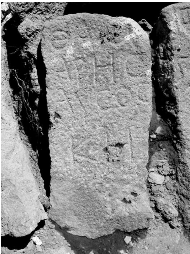
Fig. 8. Inscription 5 (stèle 6)

Traduction : « Thamarès Ausos (ou Thamarès fils d'Ausos), (âgé de) vingt-huit ans. »