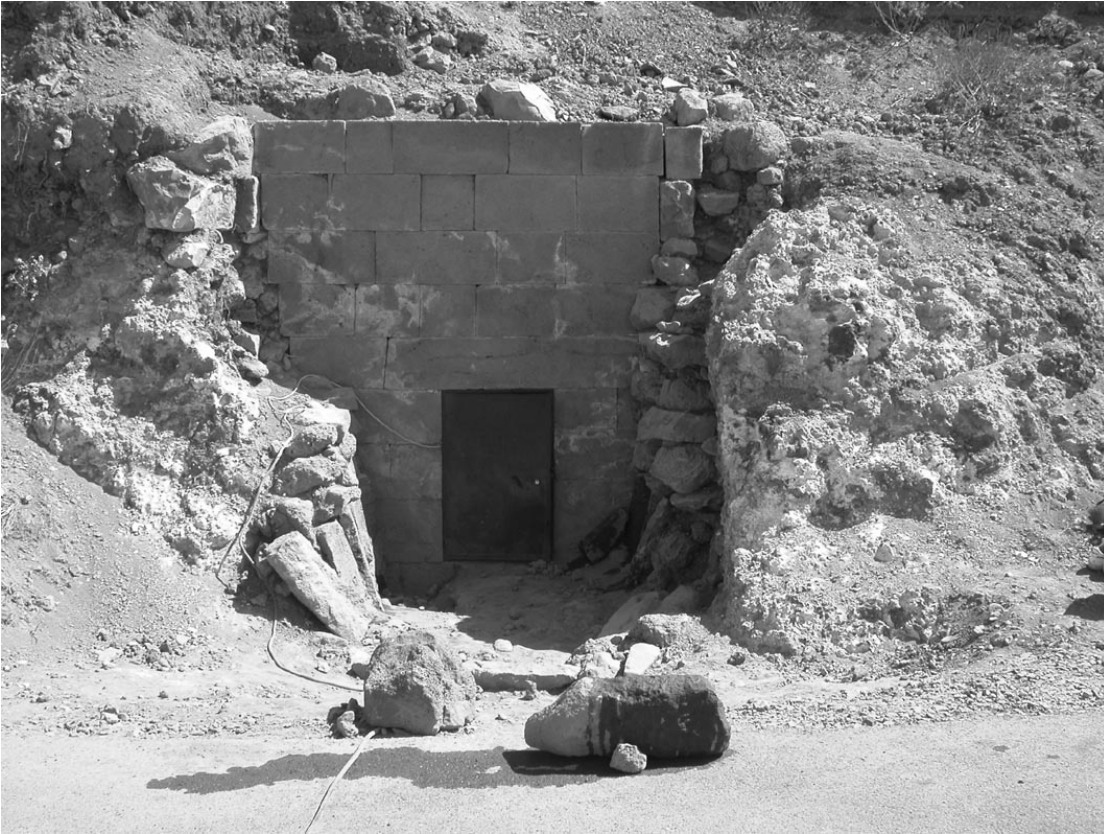
Fig. 1. L'entrée et la façade du tombeau de Salkhad, vues de l'ouest

(Fig. 3). Les stèles n os 1, 2, 3, 4, 6 et 7 sont inscrites en grec, tandis que les stèles n os 5, 8 et 11 portent chacune une inscription nabatéenne. La stèle n o 9, anépigraphue, est ornée d'une tête humaine de face au-dessus d'un méandre. Le bloc n o 10, brisé dans sa partie inférieure, porte un dessin représentant une figurine anthropomorphe stylisée, à l'intérieur d'un cartouche rectangulaire.