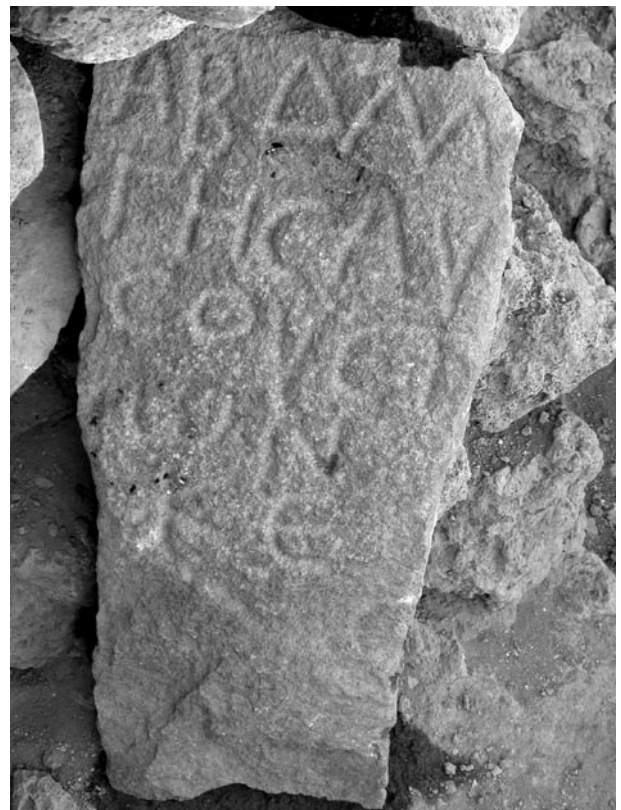
Fig. 9. Inscription 6 (stèle 7)

Traduction : « Abdalgès fils d'Ausos, âgé de vingt-cinq ans. »