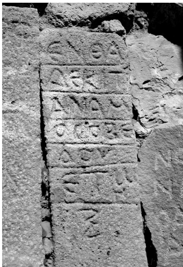
Fig. 5. Inscription 2 (stèle 2)

Traduction : « Ici repose Anamos fils d'Obedos, âgé de soixante ans. »