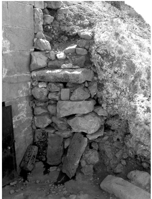
Fig. 3. Stèles 7-9 et bloc 10 (de droite à gauche)