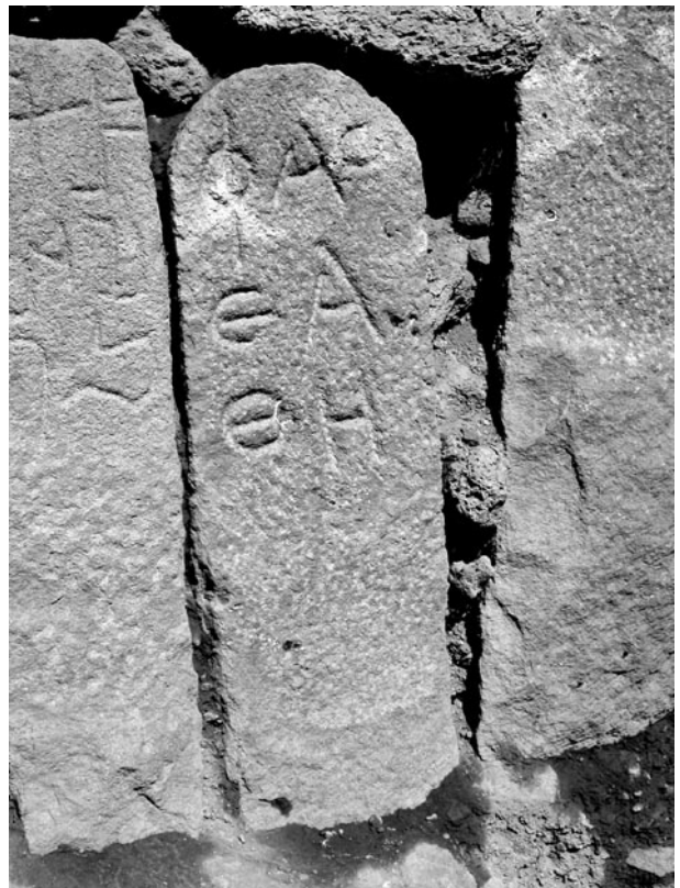
Fig. 7. Inscription 4 (stèle 4). À gauche, inscription nabatéenne (stèle 5)