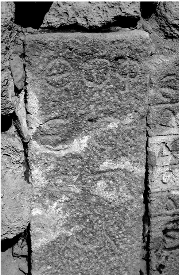
Fig. 6. Inscription 3 (stèle 3)