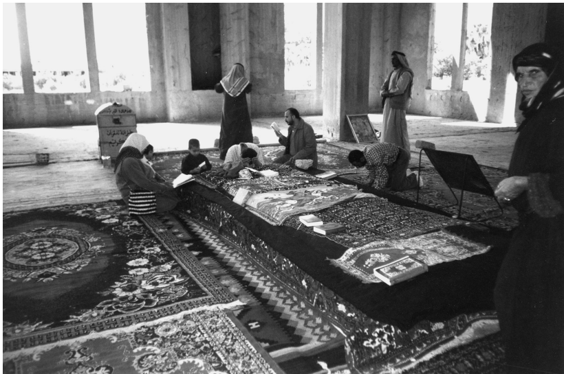
Pèlerins châwaya au mausolée d'Ammar ben Yâsir.

Les pèlerins Chawâya sont en majorité des femmes, vêtues de la tenue des bédouines, deux foulards fins et colorés noués sur la tête, des tatouages pour les plus âgées, des chaussures en plastique qui témoignent d'une pauvreté relative. Elles ne pleurent pas, mais embrassent et caressent les tapis et les corans, et laissent des tapis pour qu'ils se chargent de la baraka des saints. Au sujet des semi-nomades de sa tribu Beggâra, située sur l'Euphrate en aval des 'Afadla, Naffakh écrit en 1971 que « le domaine surnaturel de la religion et de la magie est celui qui a subi le moins de changements. La plupart des Beggâra gardent encore les mêmes croyances qui étaient jadis celles de leurs ancêtres. L'organisation du monde surnaturel correspond toujours à un schéma qui n'a pas, ou guère, varié » (Naffakh, 1971, p. 140).