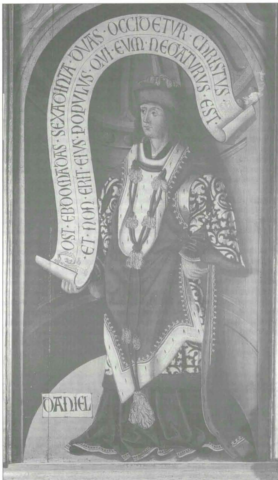
Detalle del retablo del Cristo de Caparrosa