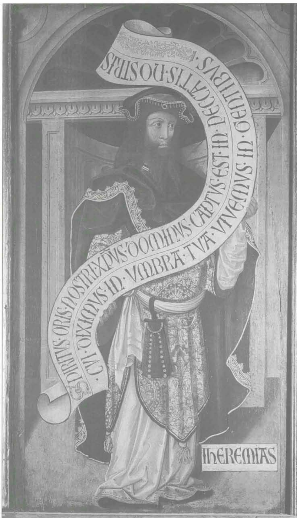
Detalle del retablo del Cristo de Caparros