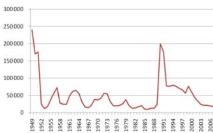
Figure.1 - L'immigration en Israël (1949-2007)