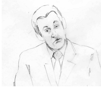
Fig. 6 : après « méfiez-vous » (TP10b)

Cette mimique bienveillante et de bon aloi (sourire, inclinaison latérale de la tête avec regard co-orienté) va se répéter sous une forme outrancière en 10b,