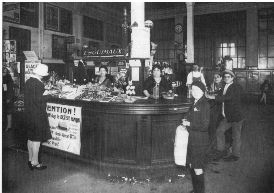
Document 1 : La buvette des années 1910 à Saint-Lazare. Un dispositif d'ambiance qui a fait basculer la gare dans un esprit de clôture et d'indépendance fonctionnelle par rapport à l'environnement extérieur. Selon les documents de l'époque, et dans une perception globale du hall de la gare, la configuration spatiale ainsi que le traitement lumineux du bar généraient un aspect festif et unificateur.