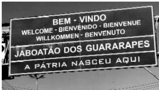
Figure 1

Paulo Reglus Neves Freire, fils de Joaquim Temístocles Freire et Edeltrudes Neves Freire, est né le 19 septembre 1921 à Recife, capitale du Pernambuco, un des états du Nordeste brésilien. Il était âgé de 10 ans quand sa famille alla s'installer à Jaboatão, ville voisine de Recife. Cette cité peut être considérée comme un lieu symbolique dans la formation historique de la patrie brésilienne à la suite de la bataille de Guararapes où le 19 avril 1648 les Portugais qui se considéraient déjà comme des Brésiliens, réussirent à vaincre les Hollandais qui convoitaient cette terre.