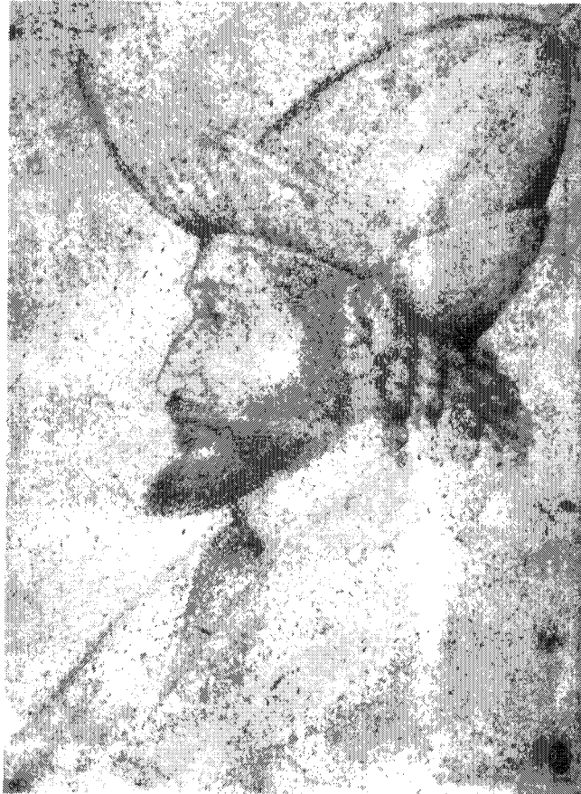
Figure 3 – Paris, Louvre, Département des Arts graphiques, inv. 2478 L. PUPPI (sous la direction de), Pisanello , Paris, 1996 ; [Réunion des musées nationaux], Pisanello. Le peintre aux sept vertus. Musée du Louvre, 6 mai – 5 août 1996 , Paris, 1996, p. 203