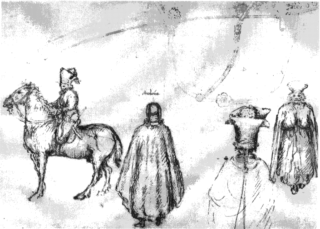
Figure 6 – Chicago, The Art Institute Margaret Day Blake Collection, 1961.331 (recto) L. PUPPI (sous la direction de), Pisanello , Paris, 1996 ; [Réunion des musées nationaux], Pisanello. Le peintre aux sept vertus. Musée du Louvre, 6 mai – 5 août 1996 , Paris, 1996, p. 199