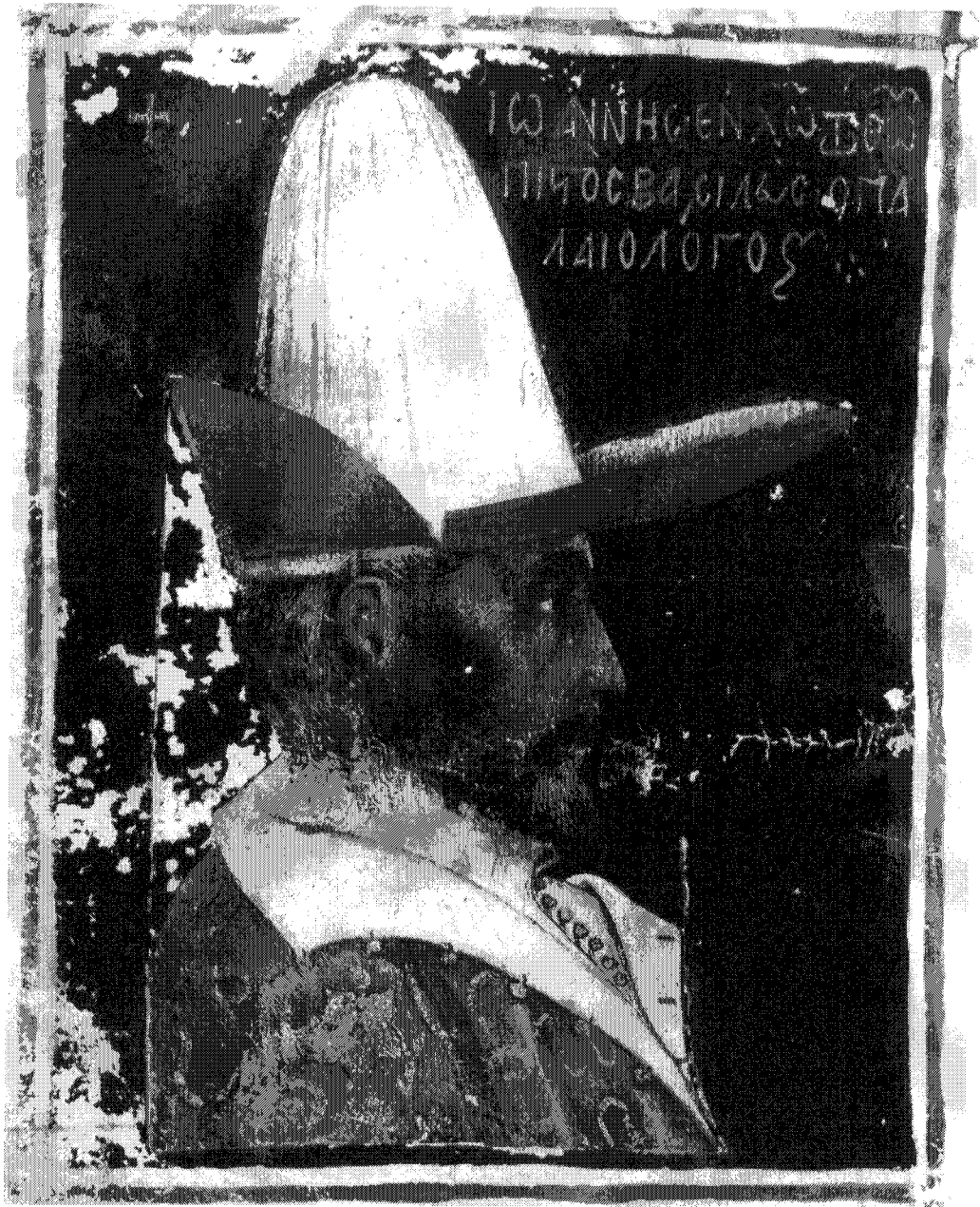
Figure 8 – Sina, Μονή τῆς Ἁγίας Αἰκατερίνης, 2123, f. 30 v G. GALAVARIS, Ζωγραφική βυζαντινῶν χειρογράφων [Ἑλληνική τέχνη] , Athènes, 1995, fig. 237