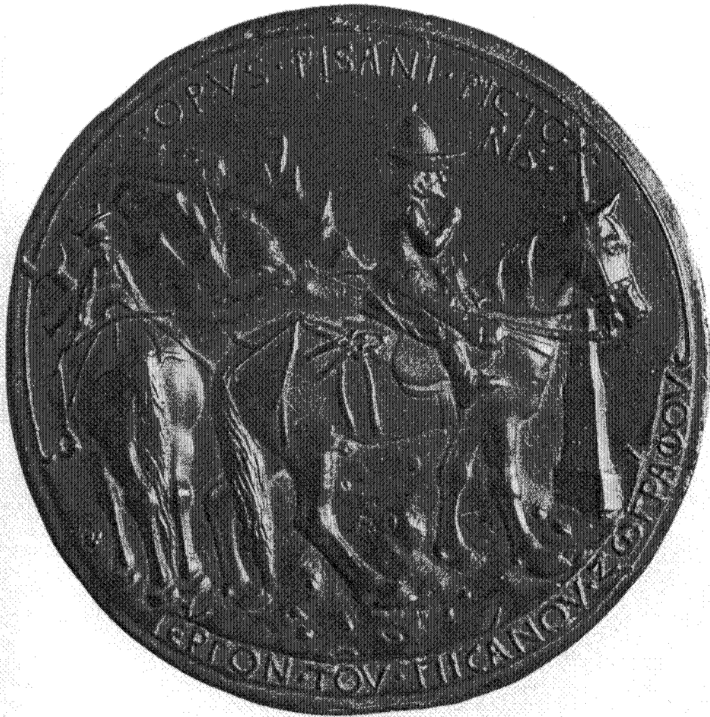
Figure 2 – Médaille de Pisanello à l'effigie de Jean VIII Paléologue (revers) M. PASTOUREAU (introd.), R. CHIARELLI (documentation), Tout l'œuvre peint de Pisanello [Les Classiques de l'Art] , Paris, 1987, pl. XXXIX