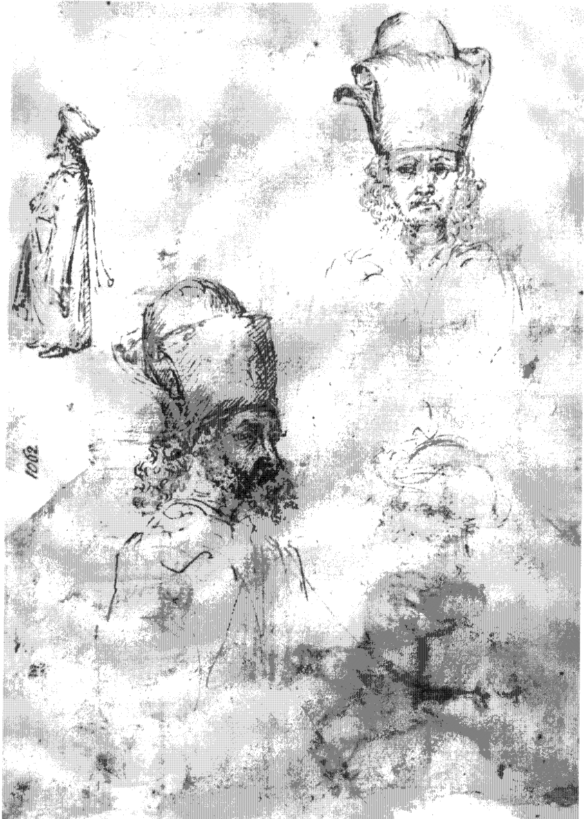
Figure 5 – Paris, Louvre, Département des Arts graphiques, inv. MI 1062 (verso) L. PUPPI (sous la direction de), Pisanello , Paris, 1996 ; [Réunion des musées nationaux], Pisanello. Le peintre aux sept vertus . Musée du Louvre, 6 mai – 5 août 1996, Paris, 1996, p. 198