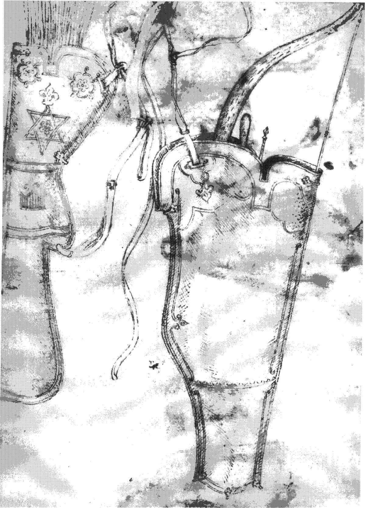
Figure 7 – Chicago, The Art Institute Margaret Day Blake Collection, 1961.331 (verso) L. PUPPI (sous la direction de), Pisanello , Paris, 1996 ; [Réunion des musées nationaux], Pisanello. Le peintre aux sept vertus. Musée du Louvre, 6 mai – 5 août 1996 , Paris, 1996, p. 199