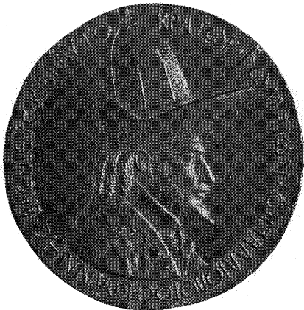
Figure 1 – Médaille de Pisanello à l'effigie de Jean VIII Paléologue (avers) M. PASTOUREAU (introd.), R. CHIARELLI (documentation), Tout l'œuvre peint de Pisanello [Les Classiques de l'Art], Paris, 1987, pl. XXXVIII