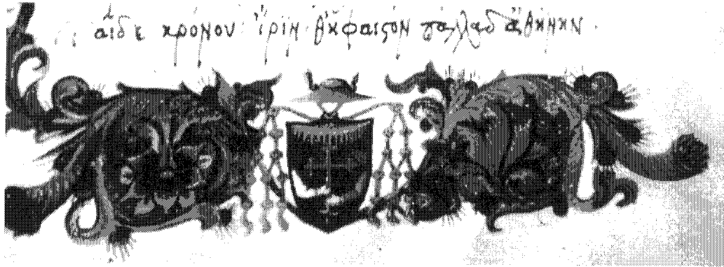
Figure 10 – Cité du Vatican, BAV, cod. Urb. Lat. 737, f° 2v (détail) : emblème de Bessarion