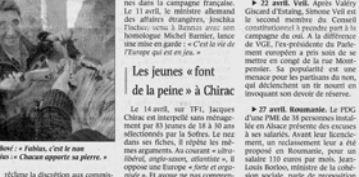
14 avril. Les jeunes « font de la pie » à Chirac.

11 avril. Le ministre allemand des Affaires étrangères, Franko Fischer, venu à Paris avec son homologue Michel Barrot, lance une mise en garde : « C'est la vie de l'Europe qui est en jeu... »