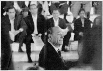
14 avril. Jacques Chirac sur TF1 devant 83 jeunes. « C'est ma fête encore plus de pie, c'est le prochain. Je ne le comprends pas, et c'est ma fête de la pie... »