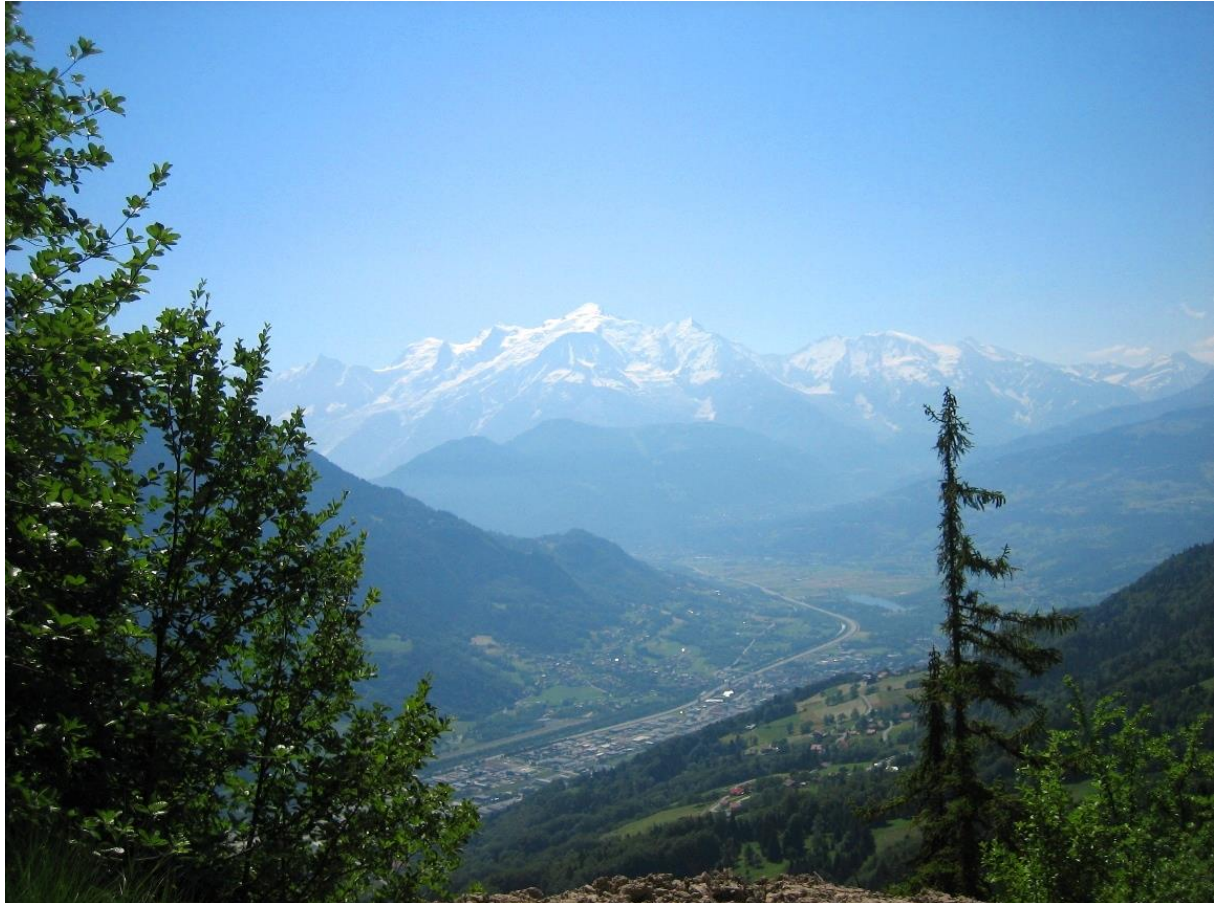
Figure 2 : l'environnement montagneux actuel de Sallanches

alpales, au cœur de nombreux litiges entre les différentes communautés. 2 L'altitude de la châtelainie varie entre 483 m à l'entrée de la vallée et 2785 m, au sommet de la Pointe Percée. La ville elle-même se situe à une altitude moyenne de 530 m.