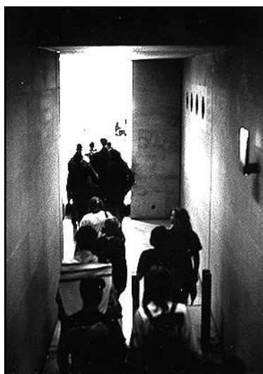
7. Puits de lumière : une entrée dans le Hall Napoléon

Mais il arrive aussi que l'inverse se produise : le puits de lumière instrumente alors l'entrée dans le souterrain (photo 7).