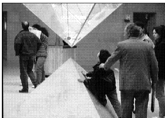
9. Fenêtre sur le ciel : l'échappée visuelle

La fenêtre sur le ciel. L'absence d'horizon de l'espace souterrain accentue le sentiment de confinement. Ce blocage de la portée du regard conduit le passant à rechercher les occasions de vision lointaine. A cet égard, l'échappée visuelle offerte par la "fenêtre" de la pyramide inversée permet de se soustraire au cloisonnement de l'espace. Arrivés place de la pyramide inversée, les passants lèvent immédiatement la tête pour porter leur regard vers le ciel. Sans concertation aucune, ils adoptent tous cette conduite de contemplation du paysage aérien. Parfois même - en particulier avec les enfants - le mouvement de la tête se prolonge par un geste ascensionnel de l'ensemble du corps (photo 9). Orienté vers le haut et débouchant sur l'extérieur, le regard pallie l'impossibilité du corps à sortir du sous-sol.