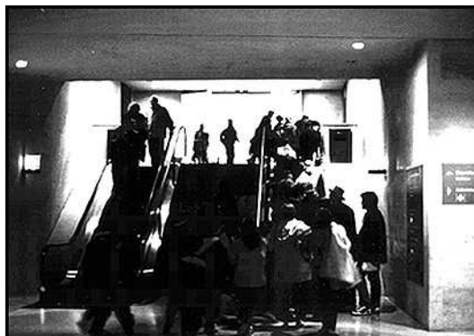
6. Puits de lumière : une sortie vers la rue de Rivoli

THIBAUD, Jean-Paul. Mouvement et perception des ambiances souterraines. Les annales de la recherche urbaine, juin 1996, n° 71, pp. 144-152.