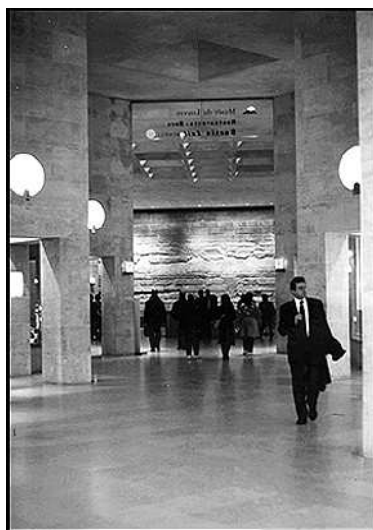
4. Mur granulé : l'attraction de la matière

THIBAUD, Jean-Paul. Mouvement et perception des ambiances souterraines. Les annales de la recherche urbaine, juin 1996, n° 71, pp. 144-152.