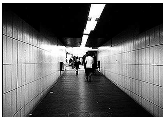
2. Couloir aveugle du métro : l'injonction au déplacement

INJONCTION AU DÉPLACEMENT : LE GLISSEMENT DU REGARD. Les couloirs aveugles du métro reliés au Grand Louvre fonctionnent pratiquement comme une injonction au déplacement : forte directionalité de l'espace produite par l'étroitesse du passage et la ligne de lumière au plafond, absence totale d'objets ou d'inscriptions retenant le regard, sol dépourvu de tout obstacle, surfaces opaques délimitant un champ de vision très restreint (photo 2).