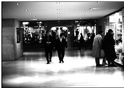
3. Allée de France : l'incidence de l'illumination des vitrines sur l'orientation visuelle des passants

Ces effets de centration, glissement et anticipation du regard deviennent d'autant plus manifestes quand on compare les couloirs du métro à l'Allée de France. Bordée de vitrines, cette galerie souterraine - elle aussi cadrée - tend au contraire à dilater l'espace visuel, à solliciter la vision latérale et à offrir des occasions de pause (photo 3).