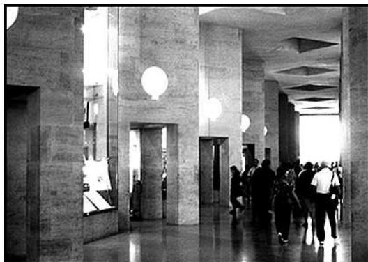
5. Puits de lumière : le guidage de la lumière

THIBAUD, Jean-Paul. Mouvement et perception des ambiances souterraines. Les annales de la recherche urbaine, juin 1996, n° 71, pp. 144-152.