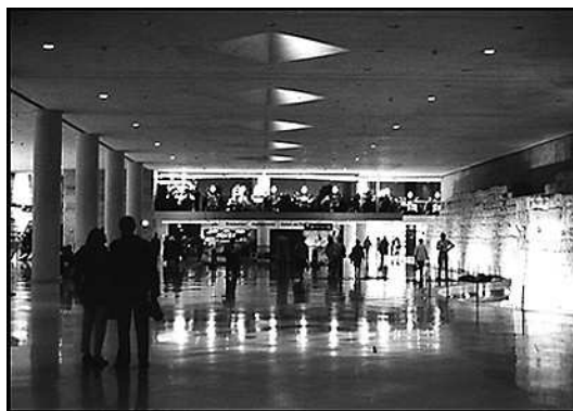
8. Sol miroitant : la déstabilisation du pas

Le sol miroitant. Le cas du Fossé Charles V offre un exemple du caractère problématique de ce contrôle opto-moteur. La réflexion de la lumière du plafond sur le sol produit une dilatation verticale de l'espace visuel et crée une ambiguïté quant à la nature du support matériel sur lequel le passant est supposé marcher : "on voit les reflets du plafond, donc ça donne aussi une espèce de dimension, on a l'impression d'être sur... un fleuve, sur une rivière, il y a un reflet permanent ", "ça me fait un peu penser à... une promenade nocturne au bord de la mer" (photo 8). Les hésitations de la parole en recherche du terme adéquat (traduites par les points de suspension) et les expressions employées par les visiteurs ("ça me fait penser à", "on a l'impression") indiquent une incertitude quant à la réalité de ce qui est perçu ; l'association du sol à une matière liquide ("mer", "fleuve") questionne la fermeté du plan horizontal.