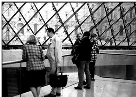
10. Les loges du public : spectacle en sous-sol

Les loges du public. La plupart du temps, les visiteurs qui entrent sous la pyramide par la cours Napoléon marquent un temps d'arrêt et mentionnent la présence des passants situés au sous-sol. Les nouveaux arrivants ne semblent pas pouvoir faire autrement que d'observer ce qui se passe en contrebas (photo 10). Ce belvédère d'entrée produit un effet d'attraction tout en rendant le visiteur captif de celui-ci en lui offrant un véritable spectacle : "quand on s'avance on est attiré par un puits, c'est plutôt fait pour qu'on profite du spectacle", "je pense que cette plate-forme est conçue pour qu'on s'y arrête", "là, on surplombe la grande arène", "d'habitude on a une impression de tableau vivant", "on peut voir tout le monde à l'intérieur". Les termes comme "arène", "belvédère" ou "balcon panoramique" rendent compte du point de vue privilégié qu'occupe le nouvel arrivant. En offrant une vision plongeante de l'activité du hall d'accueil et en proposant un sous-sol lumineux uniformément clair qui surexpose les passants situés en contrebas, ce dispositif met en scène la présence du public. Transformé momentanément en spectateur, le nouvel arrivant assiste à une représentation à laquelle lui seul décide de mettre fin.