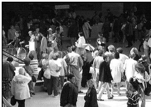
1. Hall Napoléon : la densité du public limite la portée du regard, diminue la visibilité du sol et restreint la mobilité.

THIBAUD, Jean-Paul. Mouvement et perception des ambiances souterraines. Les annales de la recherche urbaine, juin 1996, n° 71, pp. 144-152.