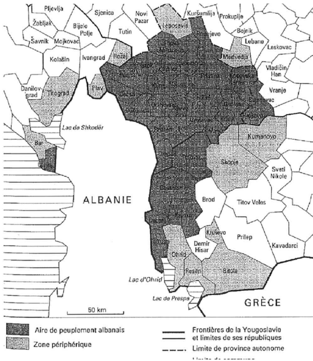
FIGURE 3 Aire de Peuplement Albanais en ex-Yougoslavie. 19

social, les attributs géographiques de chaque région, les aires traditionnellement préférentielles pour chaque région en matière d'alliances matrimoniales, les divisions religieuses de la population, et surtout les interactions avec les divers groupes ethniques voisins. Néanmoins, en conséquence d'une longue coexistence en proximité territoriale, des relations économiques et sociales serrées, de l'influence réciproque et des destinées historiques communes, les villages se sont forgé des consciences sociales et des traditions culturelles spécifiques. Les attributs de leur cohésion sont devenus plus marquants et relativement différents en passant d'une entité territoriale à l'autre, parallèlement aux traits plus ou moins intégrés constituant le fonds culturel commun à l'ensemble de la société albanaise. La dynamique historique des entités territoriales, leur élargissement ou leur morcellement, sont les indices d'une conscience régionale relativement précaire. Cela apparaît plus clairement quand des parties de la communauté régionale plus large s'émiettaient et des territoires entiers demeuraient en dehors ou formaient des unités culturelles séparées. Les facteurs les plus divers ont agi à travers les siècles dans la formation d'un tableau varié, caractérisé par la mobilité et le dynamisme des traits culturels régionaux.