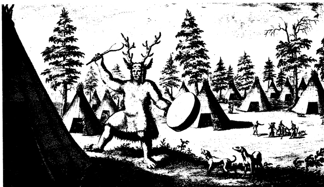
een Schaman ofte Duysel-priester. in't Tungusesen lant

Fig. 2. Représentation d'un chamane toungouze (Sibérie) portant bois de cerf, oreilles d'animal, pieds d'ours et vêtement de fourrure et frappant sur son tambour (d'après N. C. Witsen 1705).