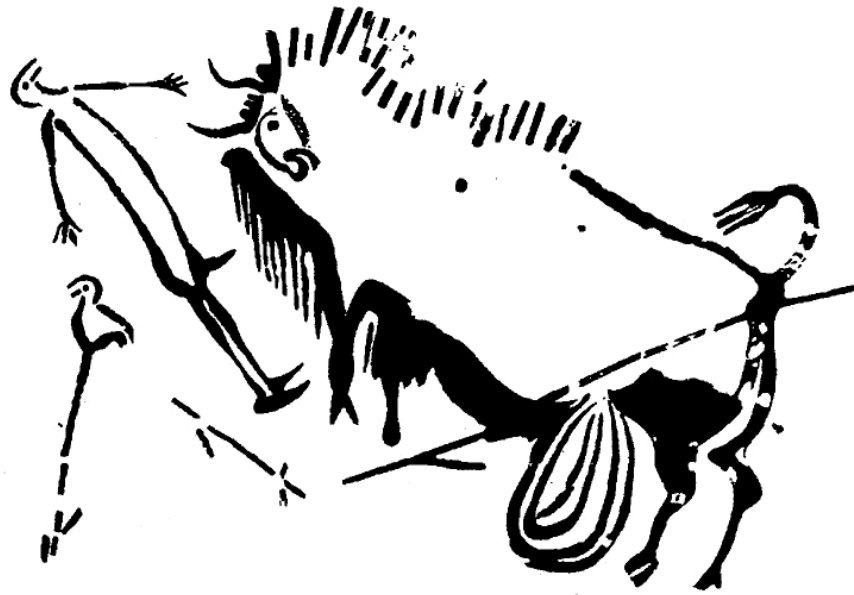
Fig. 3. La scène du Puits de Lascaux : homme « renversé » par un bison (calque de l'abbé André Glory, in Leroi-Gourhan & Allain 1979 : 291).

monté d'un oiseau ; l'interprétation sera reprise par Karl Narr en 1959. Sans doute « des bâtons verticaux portant une effigie d'oiseau ont été signalés sur des tombes de chamanes de la côte nord-ouest de l'Amérique » 7 (Leroi-Gourhan 1977 : 20). Rappelons tout de même que cette figuration d'un oiseau au sommet d'un bâton est presque le seul cas connu au paléolithique 8 , à l'exception des deux propulseurs de Bédeilhac et du Mas d'Azil sur lesquels un faon est associé à un oiseau. Kirchner ne s'arrêtait pas là puisqu'il pensait que l'homme n'était pas mort, mais en transe devant le bison sacrifié, tandis que son âme voyageait dans l'au-delà. L'oiseau sur la perche, motif spécifique du chamanisme sibérien, était son esprit protecteur. La séance était exécutée afin que le chamane en extase se rende auprès des dieux et leur demande le succès à la chasse. La scène représente le moment où le chamane tombe « dans une transe délibérément provoquée... Son corps s'affaisse sur le sol pendant que son âme entreprend le voyage vers l'au-delà » (Kirchner 1952 : 254).