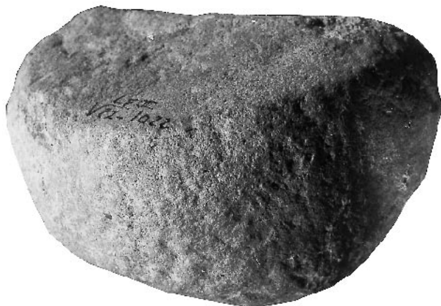
Fig. 7 – Molette en grès micacé du Magdalénien V (couche 5) de l'abri de La Faurélie II, n° V22.1022 (diam. 8,6 cm, ép. 4,8 cm). Pourtour circulaire entièrement façonné par piquetage. Face préservée aplaniée et polie par usure, avec stries parallèles visibles à la loupe binoculaire. Fouilles J. Tixier.