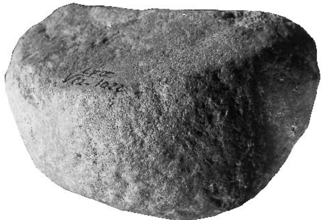
Fig. 7 – Molette en grès micacé du Magdalénien V (couche 5) de l'abri de La Faurélie II, n° V22.1022 (diam. 8,6 cm, ép. 4,8 cm). Pourtour circulaire entièrement façonné par piquetage. Face préservée aplaniée et polie par usure, avec stries parallèles visibles à la loupe binoculaire. Fouilles J. Tixier.