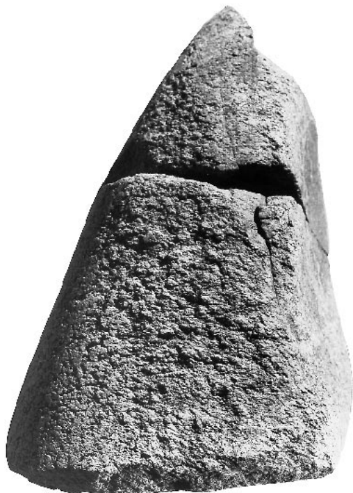
Fig. 2 – Pilon-broyeur tronconique en granite du Magdalénien supérieur (couche VIII) de l'abri du Flageolet II, n° 15' - c.VIII - 5 (13,3 × 10,1 × 7 cm). Flancs partiellement polis peut-être par suite d'une mise en forme mais le granite est trop altéré qu'on puisse trancher sur l'origine de ce poli. Par contre, le poli de la base de ce pilon est dû à l'usure. Fouilles J.-Ph. Rigaud.

qu'à un groupe restreint puisque la zone abritée n'excédait pas 100 m 2 (Célérier, 1993). Ceci suggère une forme d'occupation de l'abri qui s'organiserait autour de séjours brefs, probablement à la belle saison, d'après l'ichtyofaune. On peut s'étonner de n'y avoir pas trouvé d'autres outils sur galet mais la superficie fouillée n'excédait pas 25 m 2 , soit un quart de la surface totale de l'abri.