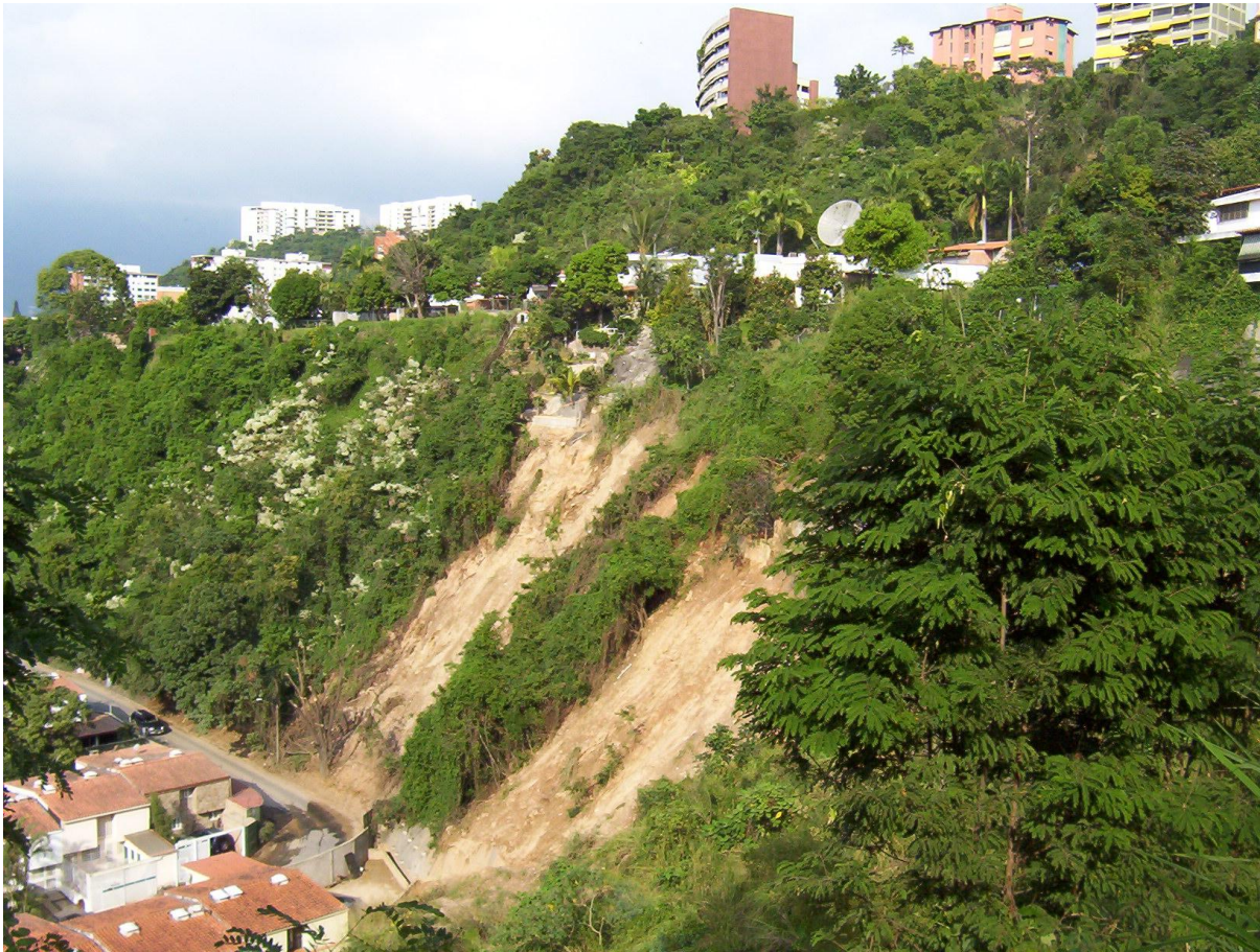
Deslizamientos en la vertiente de la cuenca en la cuál se edificó la urbanización de Santa Inés