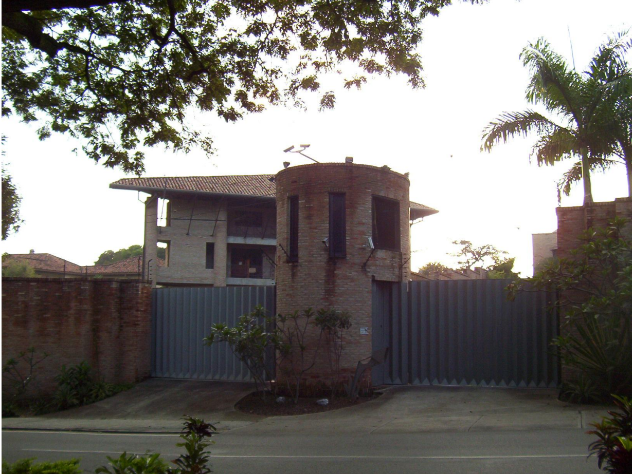
Arquitectura defensiva en el sector residencial La Florida

Al término del estudio, esperamos dar elementos de respuesta a los tres niveles de cuestionamiento inicial: