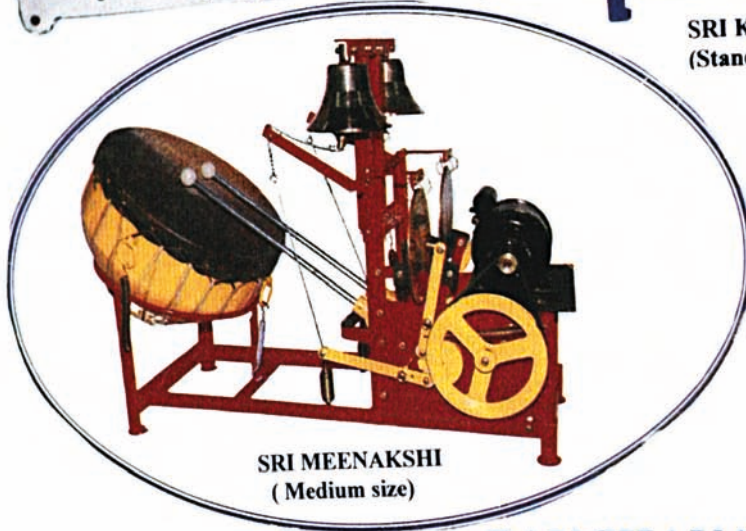
SRI MEENAKSHI (Medium size)