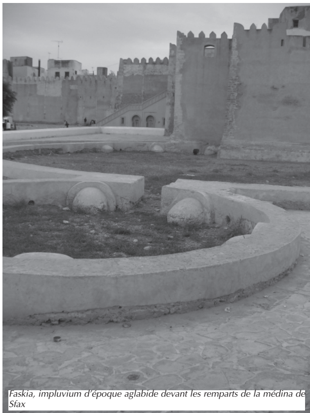
Faskia, impluvium d'époque aglabide devant les remparts de la médina de Sfax

C'est dans ce contexte des conséquences de la baisse des consommations sur les finances futures de la SONEDE et des réponses incertaines qui lui seront apportées que l'on doit essayer de mieux apprécier le développement des pratiques hors réseau.