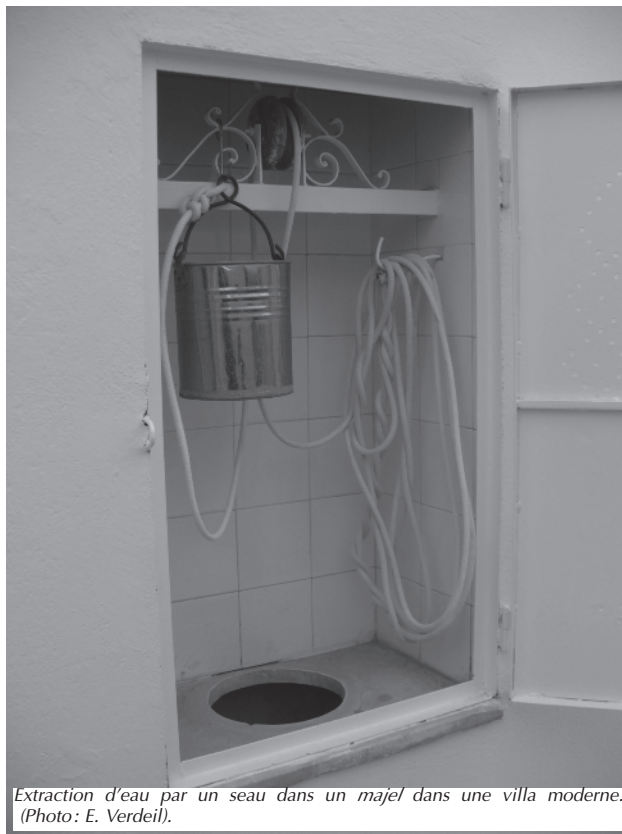
Extraction d'eau par un seau dans un majel dans une villa moderne. (Photo: E. Verdeil).

Mais la raison principale du recours au majel vient de la préférence des habitants pour cette eau du réservoir. Lorsque les logements en sont pourvus, leurs habitants préfèrent en effet utiliser l'eau du majel pour les usages alimentaires et la boisson. En dépit de sa faible teneur en sels minéraux, l'eau du majel présente un goût nettement meilleur que celle du robinet caractérisée par une salinité plus élevée et des résidus calcaires. Or, si les précautions d'entretien sont bien respectées, elle ne présente aucun danger bactériologique pour la santé. De manière