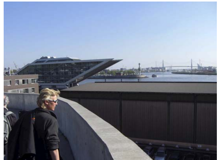
Fig.3 Façade du bâtiment « Dockland », Hambourg, photo Zepf, Fig. 4 Bâtiment « Dockland » - vue sûr le front de l'Elbe, photo Zepf