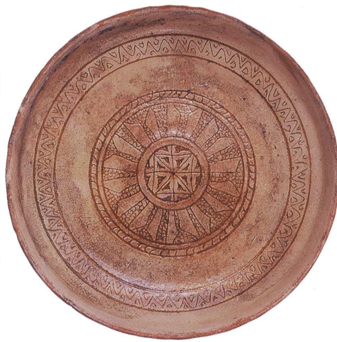
Fig. 6 : Céramique byzantine de type Fine Sgraffito Ware (d'après D. Papanikola-Bakirtzis, Byzantine Glazed Ceramics: the Art of Sgraffito , Athènes, The Archaeological Receipts Fund, 1999, p. 137)

à travers les types iconographiques – oiseau se détachant sur un fond de rinceaux isolé dans un médaillon ou bandeau de lettres pseudo-coufiques. Ces coupes dont une partie est fabriquée à Corinthe s'apparentent nettement à des vases réalisés en Perse occidentale aux X e -XI e siècles dont aucun exemplaire n'été retrouvé sur le sol byzantin (fig. 7). Leur absence pose alors le problème du mode de transmission des décors et/ou du savoir-faire qui a dû s'opérer à travers d'autres intermédiaires que la poterie ou qui résulte de transferts d'artisans. Plus tard, dans la deuxième moitié du XIII e siècle, les ateliers corinthiens produisent une vaisselle profondément marquée par les importations italiennes en nette augmentation à cette période sur le site. Il y a là une relation très nette entre une demande spécifique auxquelles répondent des importations et une adaptation de la production locale.