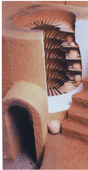
Fig. 3 : Restitution d'un four à barres. Maquette de Pierre Vallauri. Avec l'aimable autorisation de l'artiste ( Le Vert et le Brun , Marseille 1995, p. 36).

Les fours de potiers construits à Byzance sont du type dit à flammes nues; de plan circulaire, un fort pilier central ou plusieurs petits piliers supportent la chambre de cuisson et soutiennent la sole percée d'un nombre variable de trous. La forme extérieure du four correspond à un dôme avec une ouverture au sommet qui assure le tirage du foyer 17 . Or des barres d'enfournement en terre cuite ont été trouvées à Serres en Macédoine 18 ; elles indiquent qu'un autre type de four est alors en usage dans le monde byzantin à la fin du XIII e -début XIV e siècle. Il s'agit cette fois d'un four équipé d'étagères faites de barres d'argile enfoncées dans la paroi qui soutiennent les vases à cuire (Fig. 3). Ce four est caractéristique du monde islamique 19 . Aussi sa présence en Grèce du Nord est d'autant plus surprenante que la céramique réalisée dans cet atelier est une production de tradition byzantine.