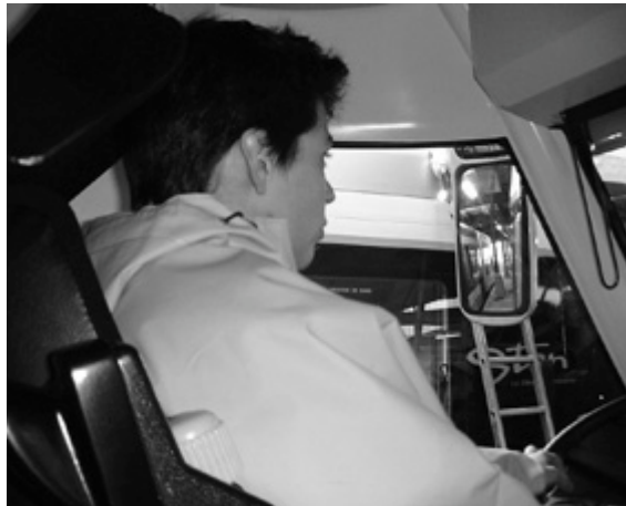
Vue du poste de conduite du TVR de Nancy

Mais la version finale, celle qui sera exploitée à Nancy et Caen, va dégrader encore la visibilité du conducteur alors que le bilan tiré de l'expérimentation sur la ligne du Trans-Val-de-Marne alertait les acteurs sur le problème posé par la mauvaise visibilité du conducteur du fait de la conception de la cabine. En effet, le design occulte les deux miroirs supérieurs des rétroviseurs latéraux.