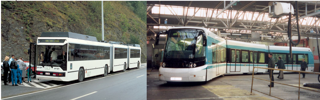
GLT, sur une ligne touristique des Ardennes belges (1987) TVR, avec un design tram, expérimenté sur la ligne du TVM (1998)

Quand Bombardier reprend la Brugeoise et Nivelles, après une prospection commerciale en Grande-Bretagne, il apparaît que le seul marché potentiel se situe en France, le GLT (guided light transport) devient le TVR (transport sur voie réservée). Il change aussi d'apparence et perd son apparence de bus pour se fondre dans le monde des tramways. Ce travail d'identification du TVR à un tramway est encore renforcé lors de son achat par Nancy. Tout se passe comme s'il fallait à tout prix effacer la marque routière de ce véhicule bi-mode.