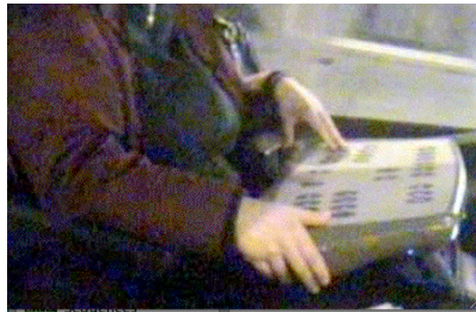
Poignet maintenu en flexion

De plus, la présence d'un système de veille, dispositif destiné à prévenir les conséquences d'une défaillance du conducteur, sous forme d'un bouton sur chacun des côtés de la tablette (l'un ou l'autre pouvant être utilisé) sur lequel le conducteur doit agir de façon régulière par appuis et relâchements, rigidifie la position de conduite.