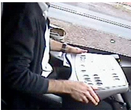
Pouce maintenu en position surélevée

La couleur rouge adoptée par le constructeur pour les commandes de gong et de klaxon, afin d'en faciliter le repérage, manifeste la méconnaissance de l'activité des conducteurs. En effet, on constate qu'en circulation, les conducteurs conservent la main gauche en position prête à actionner le gong. Ce choix est déterminé par la fonction même de cette commande. Ayant valeur d'alerte aux véhicules ou aux piétons environnants, il est en effet indispensable de garder son attention focalisée sur l'environnement extérieur lors de cette action et donc de ne pas devoir détourner son regard pour repérer la commande et l'actionner. En l'absence de repérage tactile, permettant de différencier le gong des autres boutons de commande, les conducteurs sont contraints de fixer leur main gauche et les doigts, dans une position prête à actionner la commande de gong. Cette contrainte est un facteur de risques de TMS, car elle oblige à maintenir les doigts en extension (ici le pouce) et/ou, selon les positions adoptées, à garder le poignet en flexion, induisant en conséquence des efforts constants, source de douleurs et de risques d'atteintes articulaires.