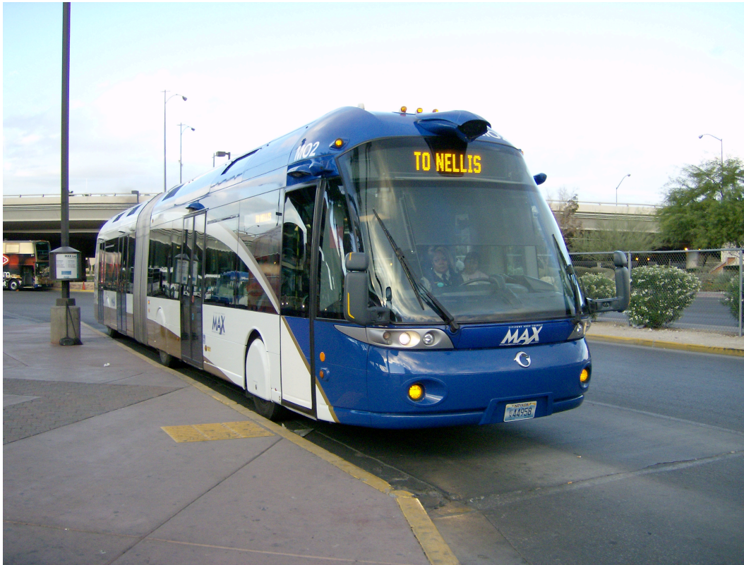
Le Civis à Las Vegas avec sa conduite centrale et ses rétroviseurs latéraux positionnés très bas

Mais cette suppression des rétroviseurs se fait dans « l'oubli » de la norme routière qui fait obligation aux véhicules routiers d'être équipés de rétroviseurs latéraux. On peut supposer qu'il avait été fait l'hypothèse qu'un véhicule aussi innovant pourrait probablement obtenir une dérogation dès lors qu'il avait un dispositif de rétrovision plus moderne à l'instar de ceux équipant les tramways. Le design de l'avant n'a pas prévu l'installation de cet équipement « archaïque ».