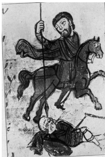
Fig. 2 – BNF, Paris. grec 923, f. 329 r (détail) (reproduction depuis, K. Weitzmann, The Miniatures of the Sacra Parallela. Parisinus Graecus 923 , Princeton, N. J. 1979, fig. 111)