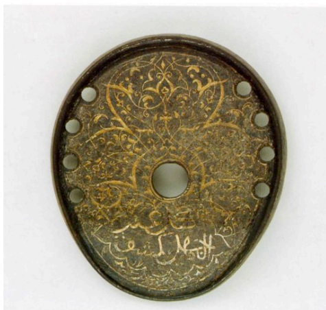
Fig. 5 – Fer à cheval de type oriental (turc) (reproduction depuis, Chevaux et cavaliers arabes dans les arts d'Orient et d'Occident , Paris 2002, n° 47, 112)