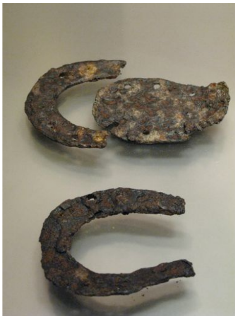
Fig. 6 - Fers à cheval de type européen et oriental (byzantins) Athènes, musée byzantin (inv. BXM 867-868), IX e -XII e s.