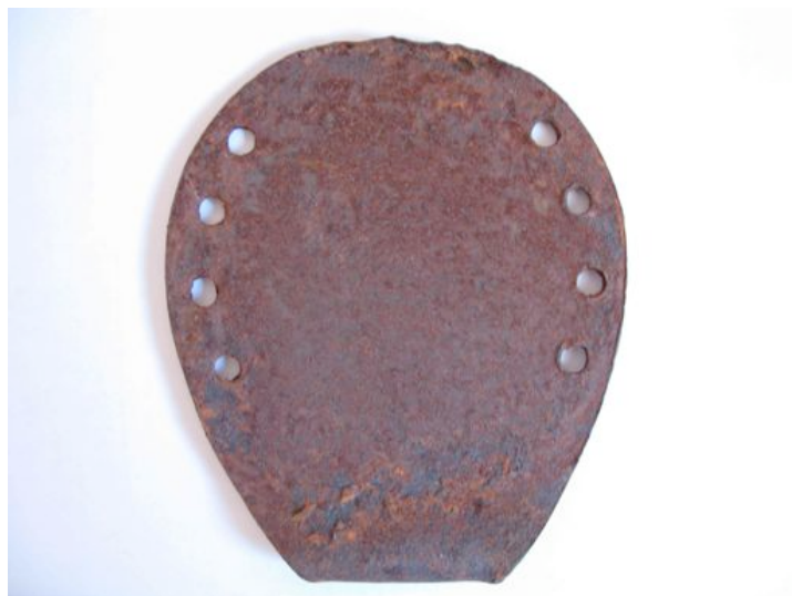
Fig. 7 - Fer à cheval de type oriental (grec moderne)