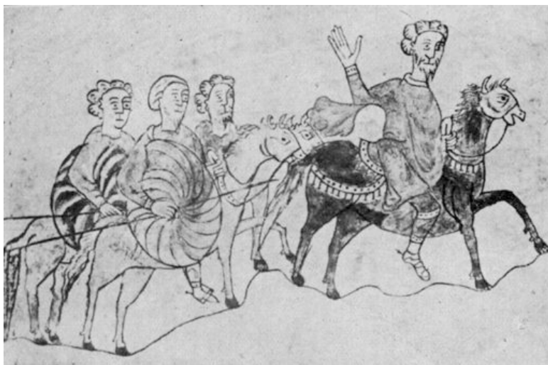
Fig. 3 – Bibliothèque municipale de Saint-Omer, Ms. 764, f. 8 v (détail) (reproduction depuis, R. Lefebvre des Noëttes (Cdt.), La force motrice animale à travers les âges , Nancy - Paris - Strasbourg 1924, fig. 144, l'auteur ne précise pas le folio)