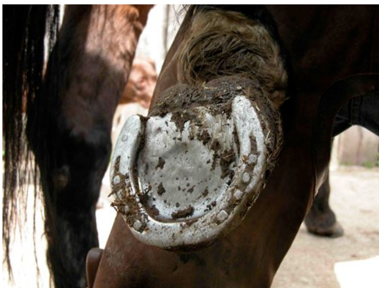
Fig. 8 – Fer à plaque