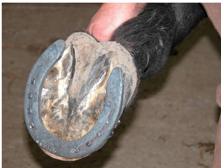
Fig. 4 – Fer à cheval de type européen