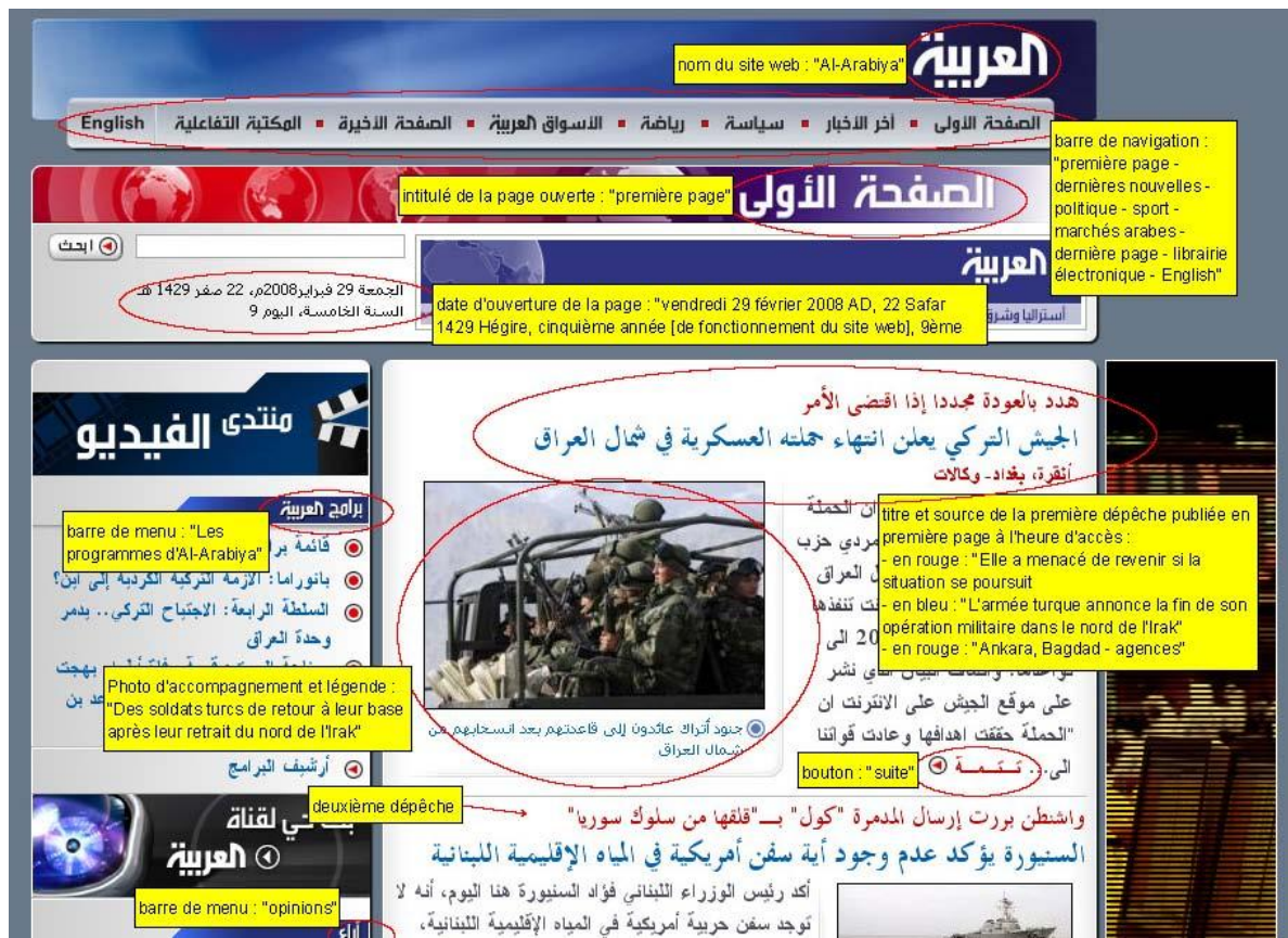
Figure 1 - Al-Arabiya, première page

Navigant sur le Web, l'internaute arabophone qui accède à la première page du site d'Al-Arabiya se voit offrir différentes possibilités, parmi lesquelles la consultation des programmes de la chaîne, la lecture d'articles d'opinion et la consultation de dépêches. Cette dernière se présente comme l'option privilégiée, eu égard à l'espace qu'elle occupe, au jeu des couleurs qui la met en scène et à l'illustration photographique qui l'accompagne. À supposer qu'il choisisse cette option, l'internaute va choisir, dans la liste affichée, celle des informations dont il souhaite connaître la suite et à laquelle il désire éventuellement réagir. L'information en question apparaît alors dans la rubrique « librairie interactive », sorte de catalogue archivé de toutes les dépêches publiées sur le site et de l'intégralité des commentaires qu'elles ont suscités (figure 2). Le site d'Al-Arabiya se présente dès lors comme un environnement heuristique ( perspicuous setting ) rendant disponibles les modes pratiques de compréhension de cet environnement 1 . C'est en effet à partir du site lui-même et dans leur usage ordinaire de celui-ci que les internautes naviguent, de manière non problématique. Autrement dit, l'espace qui s'offre à eux fournit les moyens de son intelligibilité, en tant qu'il est composé d'un récit déclencheur, pouvant être lu pour lui-même, et d'une liste subséquente de commentaires à laquelle il est possible de se raccrocher.