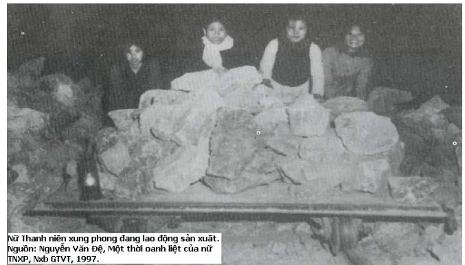
Nữ Thanh niên xung phong đang lao động sản xuất.

hay hợp tác xã nông nghiệp, số ít làm trong lĩnh vực hành chánh, những người khác làm công nhân (4,3%) hay làm thuê kiểu công nhật (6,7%) và số còn lại hoàn toàn mất khả năng lao động (12,5%) 129 . Đối với những cựu TNXP tuổi đời chỉ khoảng 20, việc quay về đời sống dân sự ở quê nhà là rất phức tạp. Sự hy sinh, khắc kỷ, dũng cảm trong những năm tháng chiến tranh tương ứng với thương tật, đốn đau và rối loạn tinh thần trong thời gian hòa bình.