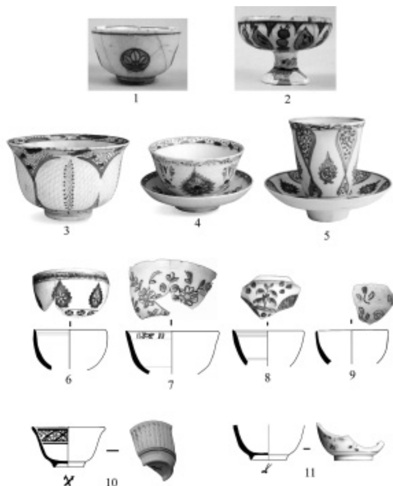
Pl. III : Fincan d'Iznik (1-2) (d'après N. Atasoy, J. Raby, 1990), de Kütahya (3-9) (d'après L. Soustiel, 2000) et tasses de Meissen (10, 11). Ech. 1:3