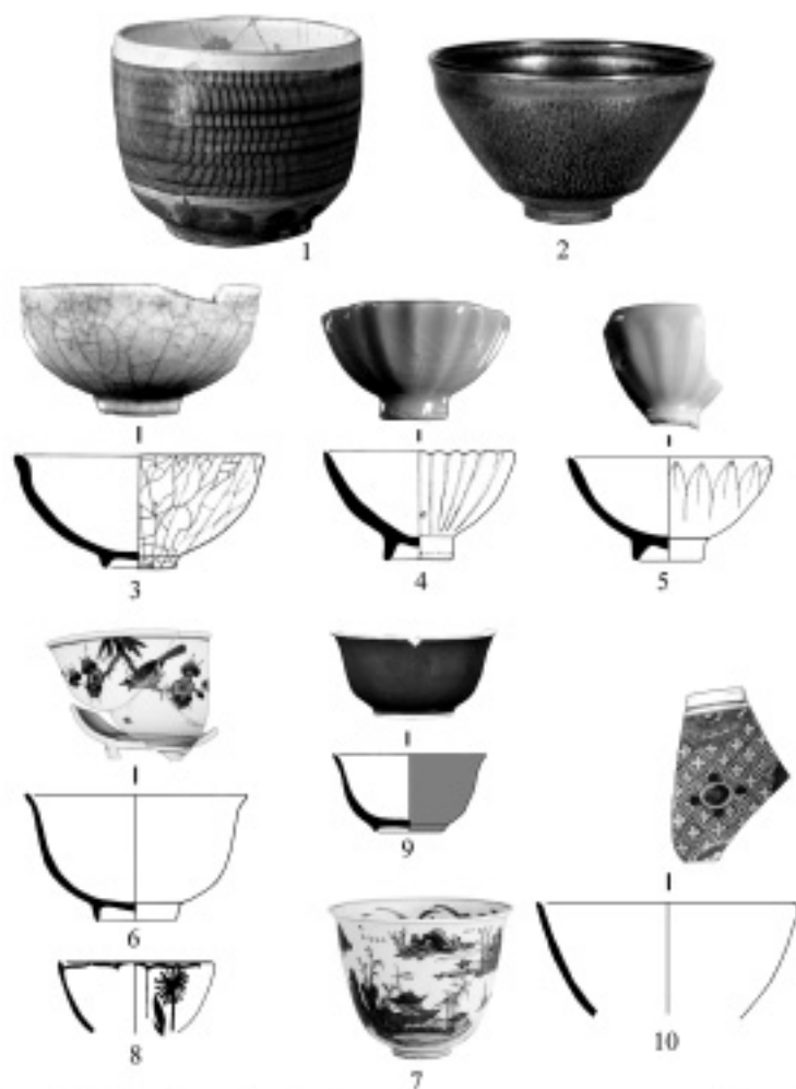
Pl. II : Grès Jian du Fujian (1, 2) (d'après J. Ayers et al. , 1984) ; céladon Guan de Hangzou (3) et céladons de Longquan (4-5), d'époque Song ; porcelaines "bleu et blanc" d'époque Ming (6, 7) ; porcelaines "bleu et blanc" (8) ; porcelaine Café-au-lait (9) et imari chinois (10) d'époque Qing. Ech. 1:3