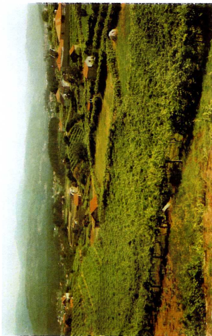
171. Padernie. Campos com vinha tradicional, separados por um «campo extremo» de vinha alvarinho, 1993.

nence peut être envisagée. A propos de résistance aux changements, beaucoup ont déjà compris qu'elle ne leur serait pas profitable, et les ingénieurs agricoles 19 rencontrent finalement peu d'objection lorsqu'ils viennent proposer à un paysan de restructurer un champ bien situé. Car financements de la CEE et rentabilité assurée sont des garanties de poids. Mais, l'associativisme demeure l'objection majeure. Selon le Président de la Adega Cooperativa de Monção 20 , la coopérative n'a été créée en 1958 que parce qu'elle devenait indispensable mais n'a jamais correspondu à la mentalité minhote, "minifundiaire" et individualiste. De même, les restructurations groupées que proposent la CEE (à des taux bien plus avantageux) ne trouvent pas preneurs: en 1992, sur 16.000 demandes de subsides, 3 seulement étaient des groupées 21 .