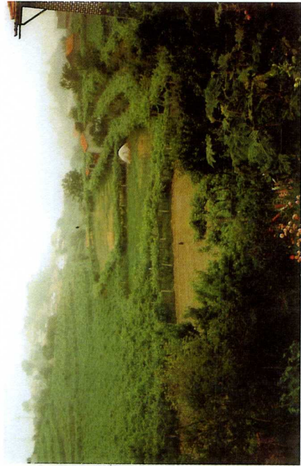
170. Pedernês. Dois campos em vitícolas tradicionais, separados por um «campo extremo» de vinha alentejana, 1983.

Verde, a d'abord été octroyée par l'Office International du Vin en 1949 et internationalement enregistrée comme appellation d'origine* à Genève en 1973 (Galhano, 1986: 85). Mais cette reconnaissance n'est pourtant pas directement à l'origine des modifications actuellement constatées. Une politique nationale peut parfois avoir des répercussions non envisagées, perceptibles jusque dans les structures agraires. Sous le régime de Salazar, où la priorité est donnée à l'économie et au maintien de l'escudo, il n'y a pas de programme de réforme agraire qui aboutisse. Cette période se traduit par un repli sur soi où chacun, dans les campagnes du Nord, essaie de produire "au mieux" car la nécessité fait loi. Les champs minihotes sont surexploités et la polyculture est de règle. Il ne s'agit plus là seulement de tradition mais de condition nécessaire à la subsistance d'un groupe, d'adaptations au milieu et au régime. Et les mouvements migratoires, certes multisculaires et commencés avec les grandes découvertes, se poursuivent avec près de 10.000 départs par an dans les années 1940, et s'intensifient significativement après les années 60 (120.000 départs en