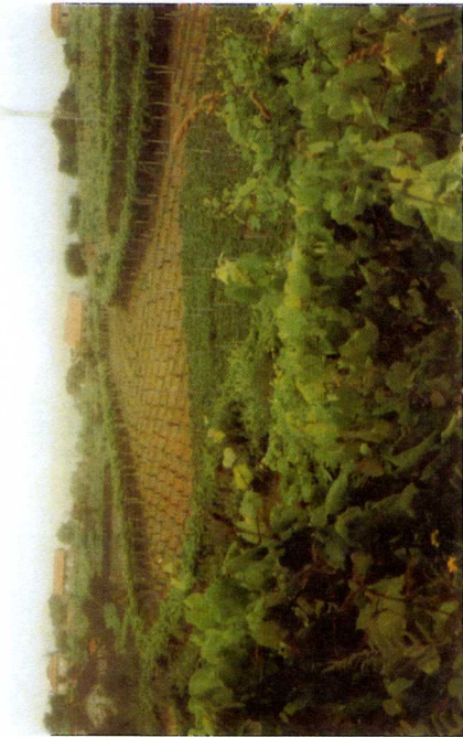
169. Prêdo. Campos de Alentejo. Alinhamento dos esteiros de suporte dos filas de arame, 1983.

Verde, a d'abord été octroyée par l'Office International du Vin en 1949 et internationalement enregistrée comme appellation d'origine* à Genève en 1973 (Galhano, 1986: 85). Mais cette reconnaissance n'est pourtant pas directement à l'origine des modifications actuellement constatées. Une politique nationale peut parfois avoir des répercussions non envisagées, perceptibles jusque dans les structures agraires. Sous le régime de Salazar, où la priorité est donnée à l'économie et au maintien de l'escudo, il n'y a pas de programme de réforme agraire qui aboutisse. Cette période se traduit par un repli sur soi où chacun, dans les campagnes du Nord, essaie de produire "au mieux" car la nécessité fait loi. Les champs minihotes sont surexploités et la polyculture est de règle. Il ne s'agit plus là seulement de tradition mais de condition nécessaire à la subsistance d'un groupe, d'adaptations au milieu et au régime. Et les mouvements migratoires, certes multisculaires et commencés avec les grandes découvertes, se poursuivent avec près de 10.000 départs par an dans les années 1940, et s'intensifient significativement après les années 60 (120.000 départs en