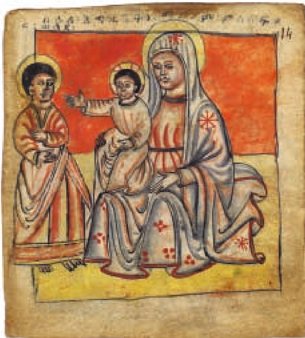
Fig. 12 Saint Georges devant Marie, recueil de peintures, ms. Éth. Abb. 113, fol. 14r, 12 x 11 cm, fin xv e – début xvi e s.?