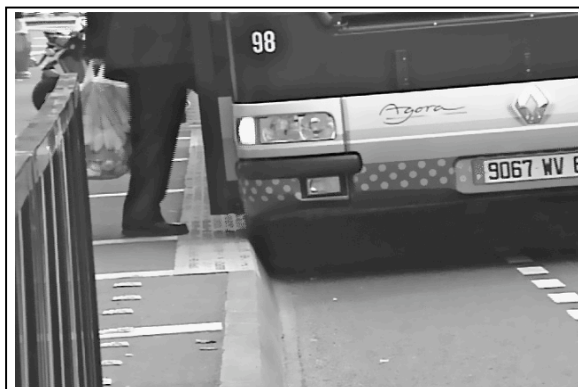
Photo 2 : Accostage en mode manuel d'un bus de la ligne « avec » guidage optique en panne à Clermont-Ferrand. Avril 2005.

À Clermont-Ferrand, à la différence de Las Vegas, les leçons de cette expérience ne sont tirées qu'au travers d'une expertise syndicale. La reconnaissance de la capacité des conducteurs à réactualiser la valeur d'un dispositif malgré la disparition du guidage optique, élément central de ce dispositif technique pour les concepteurs et décideurs, reste locale, enfermée dans l'organisation de l'exploitation du réseau. Cette innovation dans la technique d'accostage ne parvient même pas à être reconnue comme une ressource par l'autorité organisatrice du réseau de Clermont-Ferrand. Elle ne parvient pas plus à être prise en compte par les services de l'État en charge d'élaborer les bonnes pratiques et de les diffuser, le Certu (Centre d'Études sur les Réseaux, les Transports, l'Urbanisme).