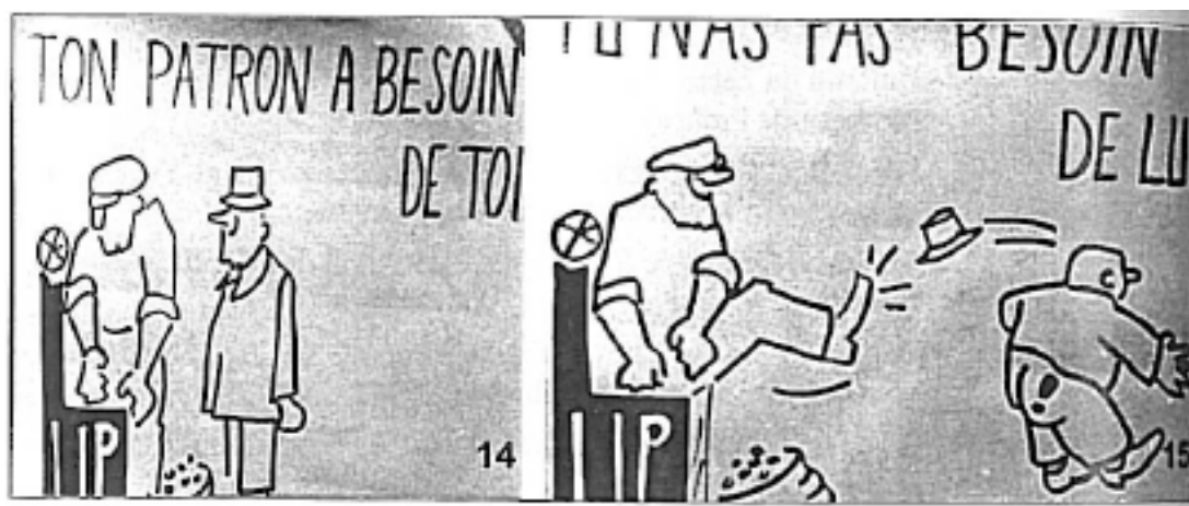
Annexe 1 : Affiche anti-patronale des ouvriers Lip