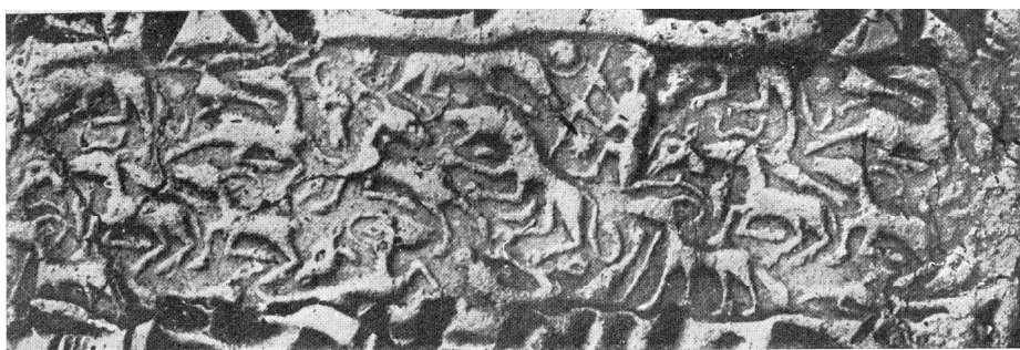
figure 6 : sceau Kt c/k 807 d'après ÖZGÜÇ N., 1965, pl. XXVII 82