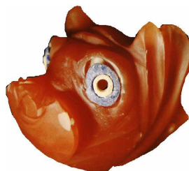
figure 3 : tête de cochon en cornaline, Kt 95/k 110 (niveau Ib) d'après le calendrier du Musée d'Ankara