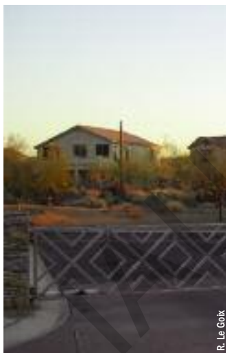
Entrée automatique d'une gated community près de Phoenix, Arizona.

À l'échelle locale, le développement des gated communities est, d'une part, une forme d'urbanisation soutenue par les collectivités locales, destinée à faire porter le coût de l'étalement urbain sur le secteur privé (promoteurs, et in fine , acquéreurs du logement), et d'autre part, un moyen efficace de protéger à long terme l'investissement immobilier. Les lotissements fermés, espaces enclos et privés, conduisent à un report des coûts d'aménagement et d'entretien collectifs sur une entité privée, tout en assu-