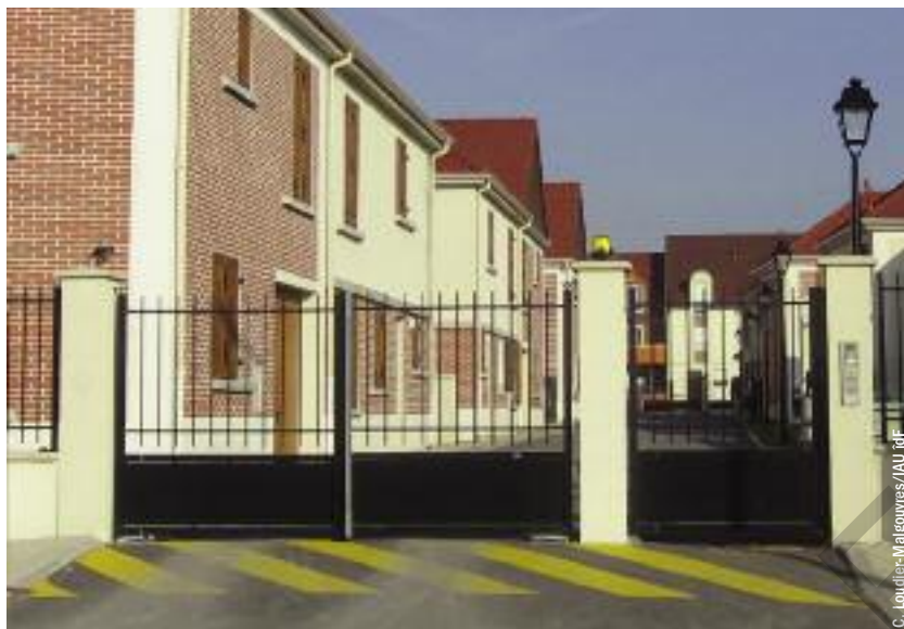
Ensemble individuel fermé neuf à Corneilles-en-Parisis, Val d'Oise.

Renaud Le Goix (1) Université Paris 1 Panthéon-Sorbonne