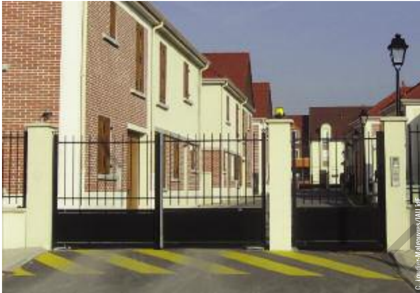
Ensemble individuel fermé neuf à Corneilles-en-Parisis, Val d'Oise.

Renaud Le Goix (1) Université Paris 1 Panthéon-Sorbonne