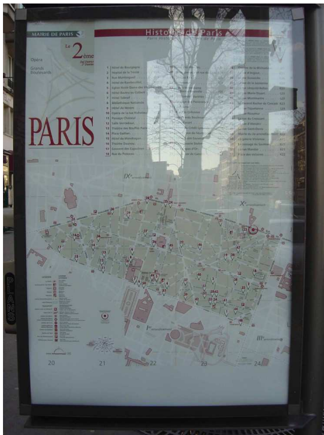
Figura 2. Panel de cartelera, Boulevard Bonne Nouvelle, Paris. El mapa representa el segundo distrito de la capital. Un punto rojo en la parte superior derecha en el límite del distrito, localiza la posición del panel.

Sin embargo, la mayoría de los mapas, que se venden o distribuyen al público en general, no se enfocan en las áreas sino las vías, pues se trata de planos de orientación destinados a guiar al usuario en el traslado de un punto a otro, a través de la red de calles o líneas de transporte. A menudo, esta segunda forma de representar el espacio minimiza la cartografía de los límites e insiste en la cartografía de conexiones. Esto lleva a plantear la cuestión sobre la oposición entre la red y el territorio. Cuando el usuario toma la red, ¿cruza el territorio como si estuviera en un túnel o lo está produciendo?