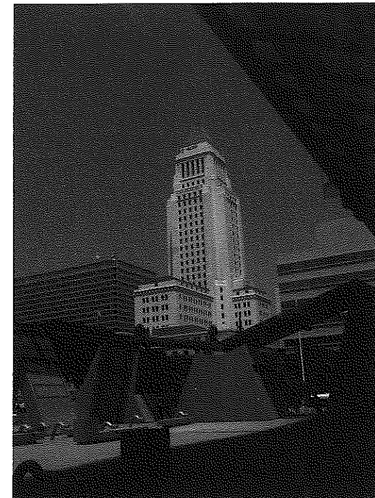
PHOTO 1A. LA MAIRIE DE LOS ANGELES (LE PLUS HAUT BÂTIMENT DE LA VILLE JUSQU'AU DÉBUT DES ANNÉES 1970)

PHOTOS 1. LE CBD ACTUEL, FIGURE DOMINANTE D'UN DOWNTOWN OÙ LE PIÉTON N'A PAS VRAIMENT SA PLACE