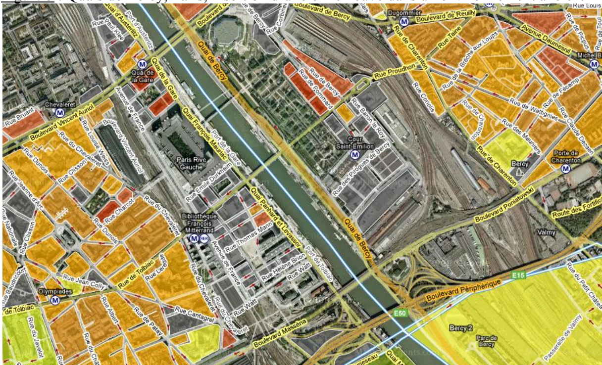
Figure 3 : Quais de Bercy, Paris, insertion d'une offre neuve dans un environnement ancien.

nouvelle voie d'accès se crée. Les différents projets autour du Grand Paris rendent la chose d'une actualité brûlante. Il s'agirait ici d'un outil pointu de pilotage des projets d'aménagement urbain permettant de contrôler les effets d'éviction de certaines populations une fois l'opération achevée. Il existe en effet des cas où des projets ambitieux ont eu pour conséquence une hausse du foncier à proximité, amenant les ménages modestes à vendre stratégiquement leur bien pour s'installer plus loin, créant ainsi de fait un quartier sans mixité sociale avec des personnes uniquement aisées. Tout projet dans un tissu urbain est un surgissement, un choc. Les modèles relevant des techniques de l'économétrie spatiale et de la géolocalisation auront très certainement à apporter leur pierre à l'édifice du débat public préalable.