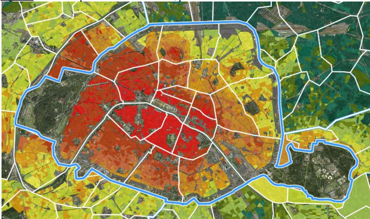
Figure 1 : Carte des prix immobiliers à Paris, par îlots