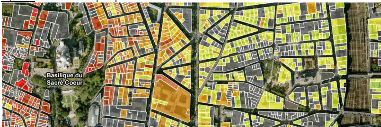
Figure 4 : Gradient des prix par immeubles sur le versant est de la butte Montmartre.