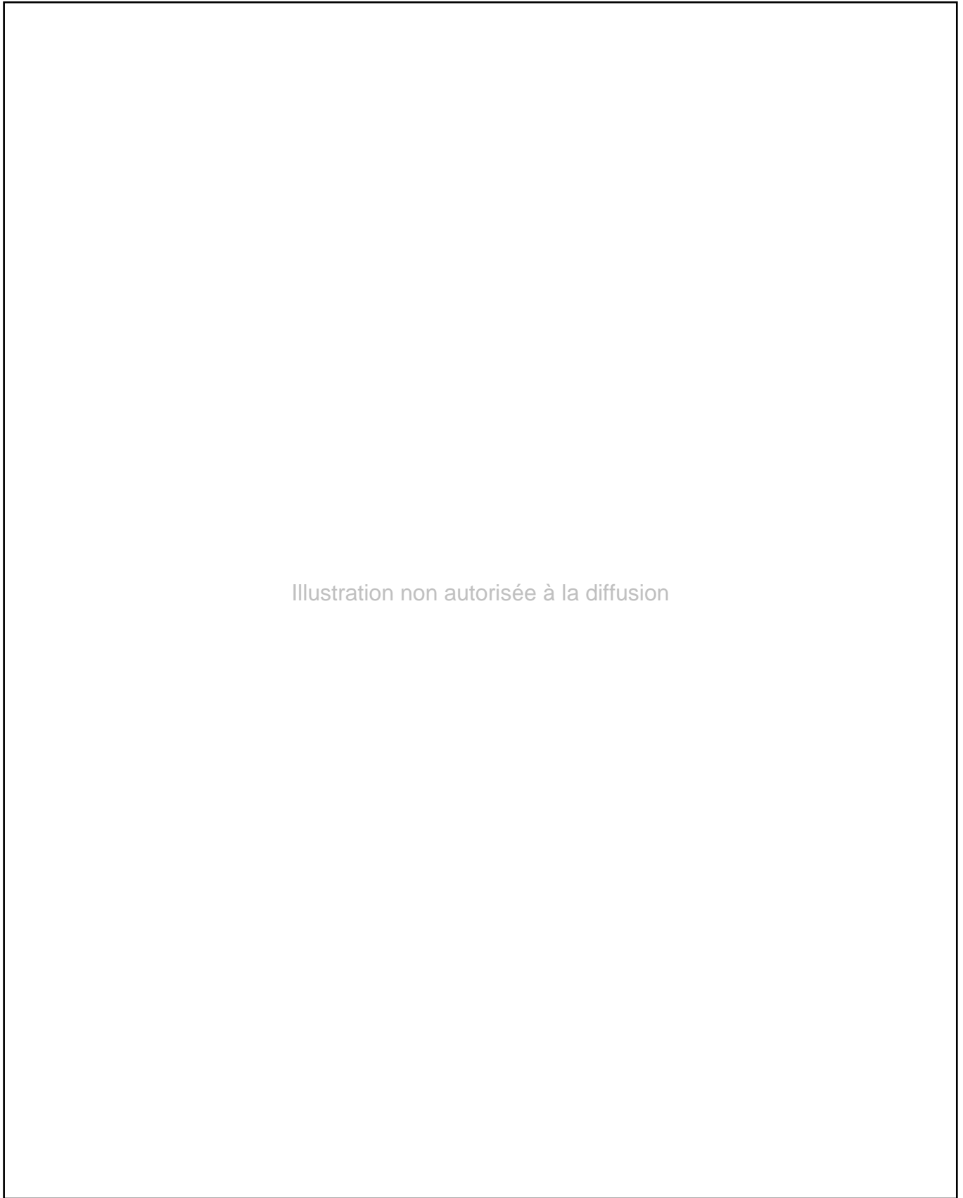
Illustration non autorisée à la diffusion

© William Berthomière, Isabelle Bouhet - Migrinter – 2000.