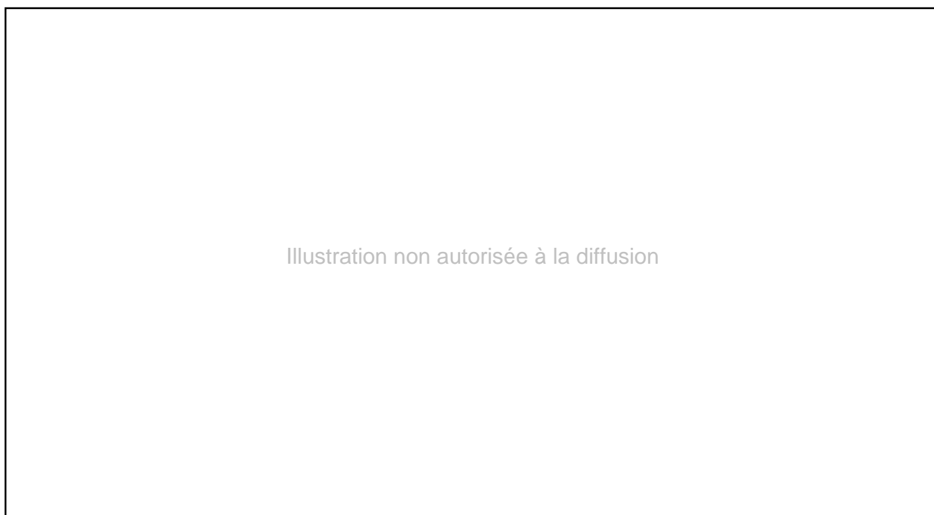
Figure 2 : Immigrés de l'ex-URSS selon leur lieu de résidence (en %)