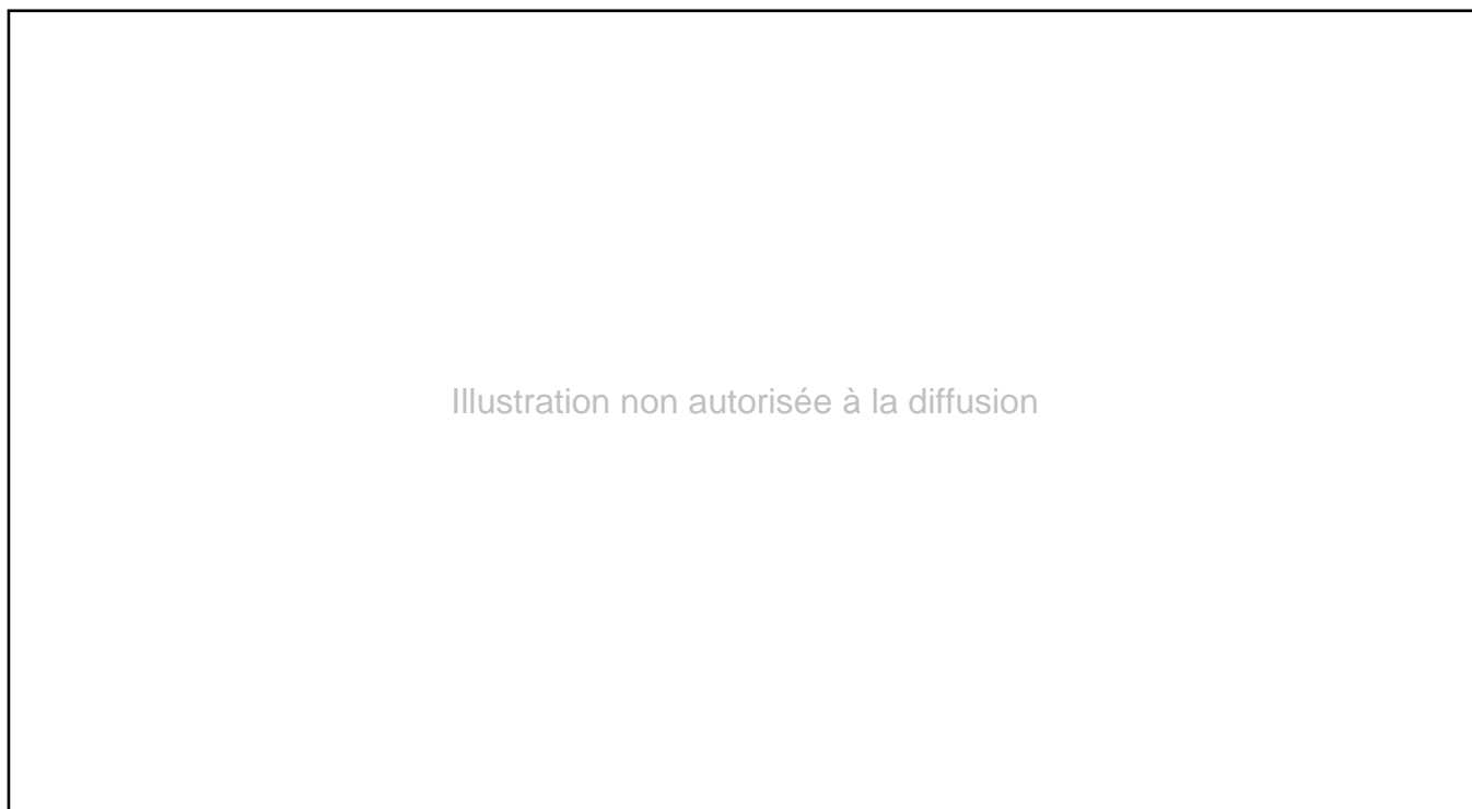
Figure 2 : Immigrés de l'ex-URSS selon leur lieu de résidence (en %)