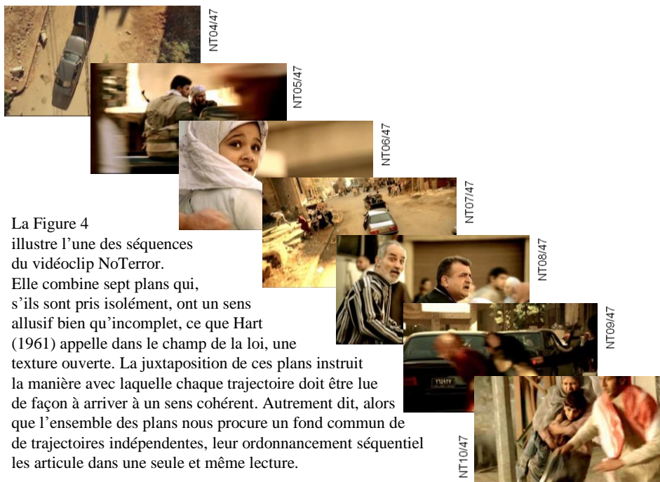
Figure 4 – NoTerror: la séquence des hommes-armés-surgissant-sur-la-place

La Figure 4 illustre l'une des séquences du vidéoclip NoTerror. Elle combine sept plans qui, s'ils sont pris isolément, ont un sens allusif bien qu'incomplet, ce que Hart (1961) appelle dans le champ de la loi, une texture ouverte. La juxtaposition de ces plans instruit la manière avec laquelle chaque trajectoire doit être lue de façon à arriver à un sens cohérent. Autrement dit, alors que l'ensemble des plans nous procure un fond commun de trajectoires indépendantes, leur ordonnancement séquentiel les articule dans une seule et même lecture.