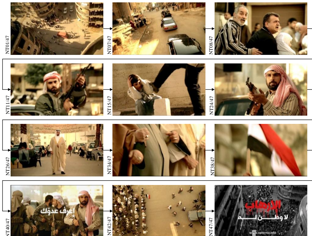
Figure 6 – NoTerror: le récit « nation versus terrorisme »

Le vidéoclip est construit comme une narration fictionnelle qui est contrainte par son format d'une minute. Autrement dit, elle montre intentionnellement, et dans un cadre contraint, les protagonistes d'une intrigue dont la force persuasive réside dans sa capacité à présenter une histoire courte et simple, bien que manichéenne. Cette narration est scénarisée et intentionnée par le producteur du spot qui a pris ses plans de manière consistante, c'est-à-dire dans le but pratique et spécifique de produire une histoire courte de plaidoyer. Il y a une sorte de réalisme dans cette production, en ce sens que le film est tourné en extérieur, dans un « vrai » quartier arabe/irakien, dans l'environnement d'une rue dont les particularités semblent « naturelles ». Cependant, l'histoire elle-même ne vise pas spécialement le réalisme : c'est une fable morale. Le producteur accentue les éléments caractéristiques de chacune des nombreuses parties et ne cherche pas à donner un compte-rendu fidèle de la