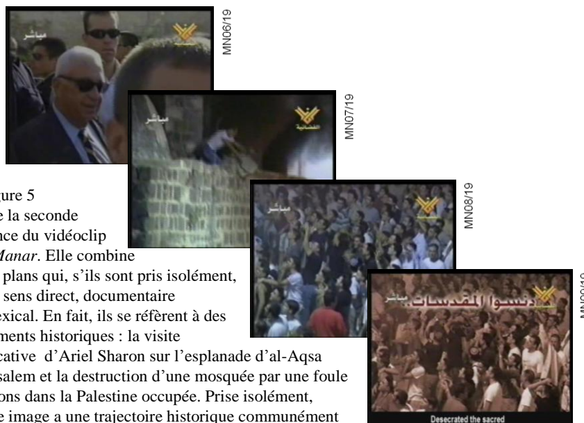
Figure 5 – Al-Manar: ils ont profané les [lieux] sacrés

La Figure 5 illustre la seconde séquence du vidéoclip d' Al-Manar . Elle combine quatre plans qui, s'ils sont pris isolément, ont un sens direct, documentaire et indexical. En fait, ils se réfèrent à des événements historiques : la visite provocative d'Ariel Sharon sur l'esplanade d'al-Aqsa à Jérusalem et la destruction d'une mosquée par une foule de colons dans la Palestine occupée. Prise isolément, chaque image a une trajectoire historique communément connue. Prises dans une séquence, ces images instruisent d'une manière très directe la lecture de la conclusion écrite : "ils ont profané les lieux sacrés".