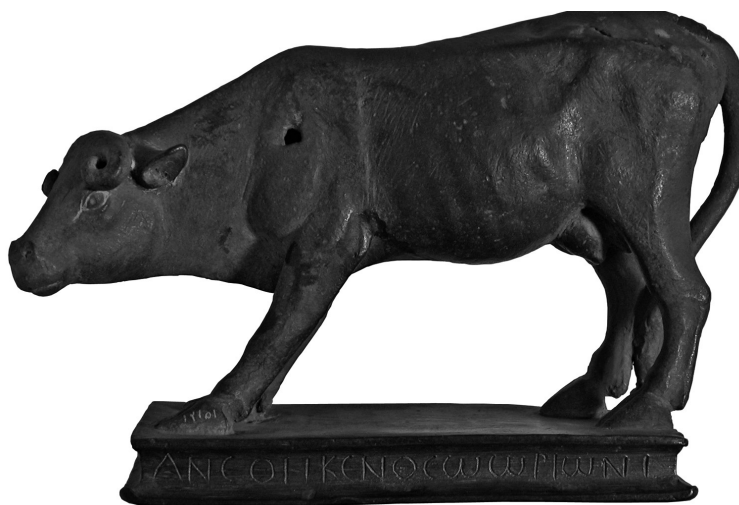
Figure 2 : Ex-voto de Bloudan (Damascène) au Musée national de Damas.