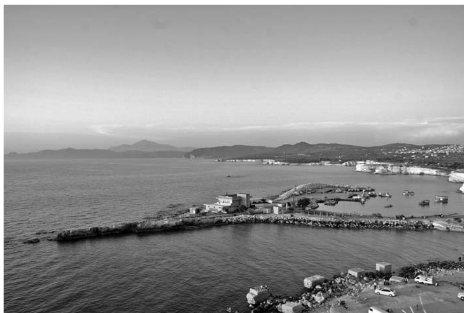
Fig. 1. La baie de Fasri, vue depuis le sud

Julien Aliquot, Institut français du Proche-Orient (Ifpo), USR 3135-UMIFRE 6, CNRS-MAÉE, BP 344, Damas, Syrie. j.aliquot@ifpoorient.org