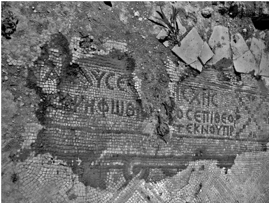
Fig. 2. La dédicace du pavement de mosaïque