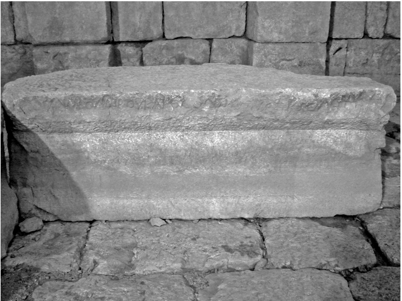
Fig. 2. Inscription inédite d'Ain el-Fijé.