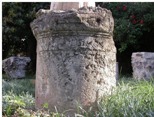
Fig. 3. Épitaphe de Démétrios : texte B.