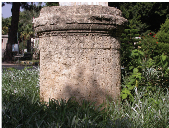
Fig. 2. Épitaphe de Démétrios : texte A.