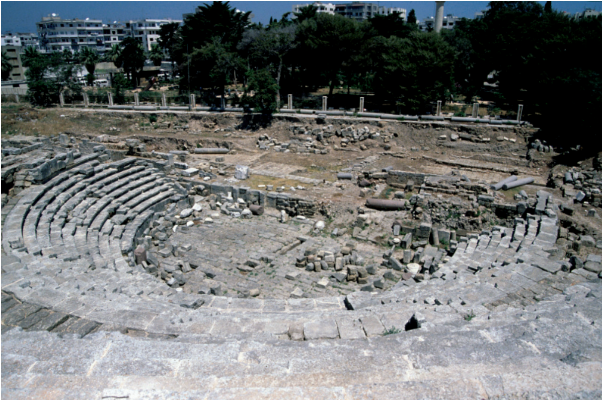
Théâtre romain de Gabala.