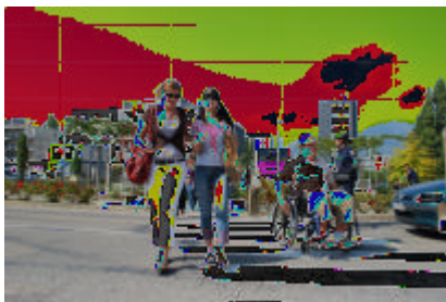
Bandeau occultant Fauteuil roulant manuel