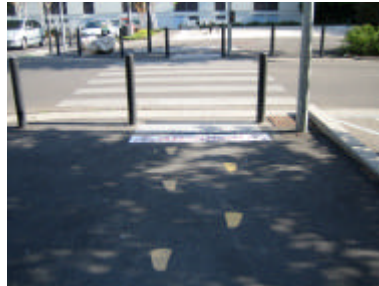
« Sur-signalisation »