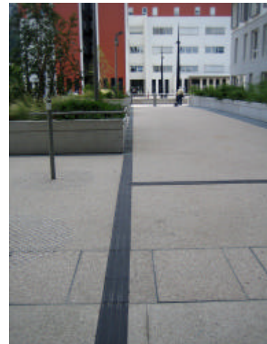
Un marquage podo-tactile au sol renforcé