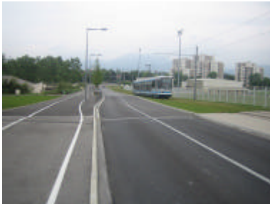
« Etanchéification » des flux

métropoles urbaines répond à la même logique et aux mêmes préoccupations. Au nom d'une meilleure «durabilité», la grande ville et ses espaces piétons se «végétalisent». Rares sont ainsi les métropoles où l'arrivée du tramway ne s'accompagne pas de l'implantation de «coulées vertes» et où la refonte d'un centre-ville piéton ne se fait pas sans un « plan de fleurissement », censé embellir le cadre de vie et apaiser les tensions de la vie urbaine.