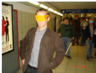
Lunettes de simulation de la malvoyance