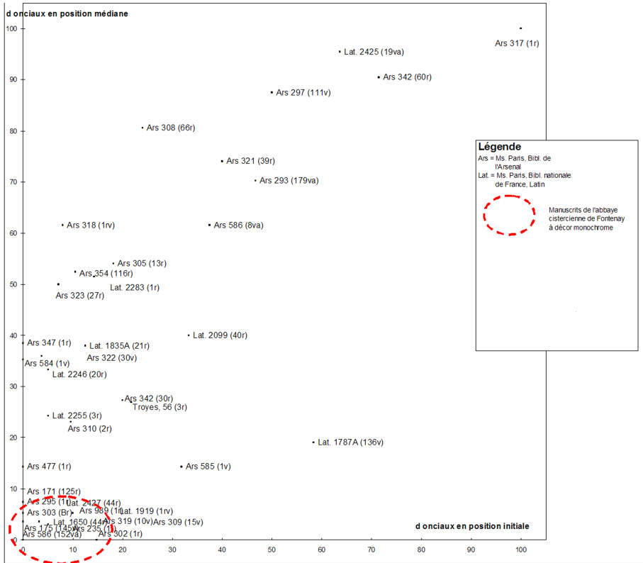
FIGURE 3. Régularisation de l'écriture dans les manuscrits à décor monochrome (spécialisation de la forme onciale de d pour la fin de mot).

A Fontenay, l'analyse paléographique et codicologique démontre que ces manuscrits partagent de nombreuses spécificités outre leur décoration. En particulier l'emploi des formes droite et onciale de la lettre d montre une spécialisation des formes de cette lettre d dans les manuscrits à décor monochrome, où la forme onciale est exclue des positions initiales et médianes et strictement réservée à la finale.