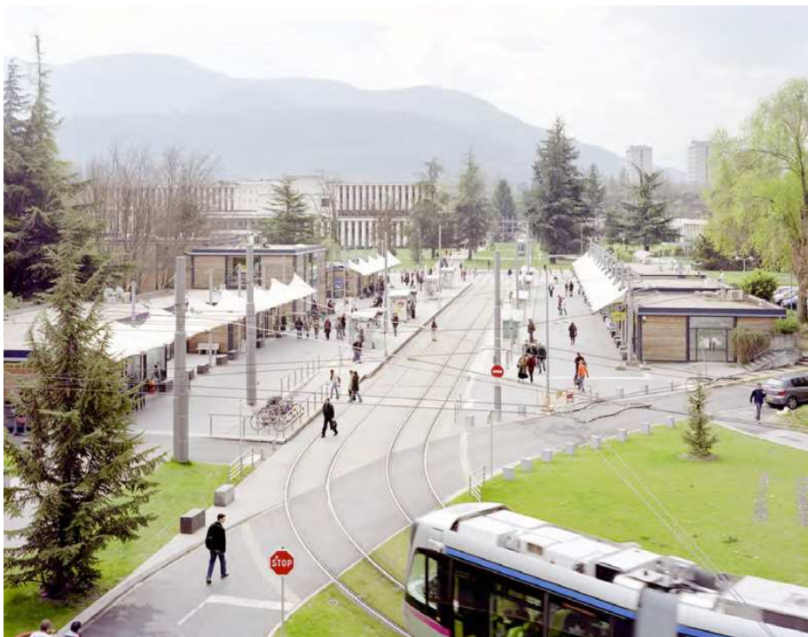
Campus Universitaire de St Martin d'Hères.