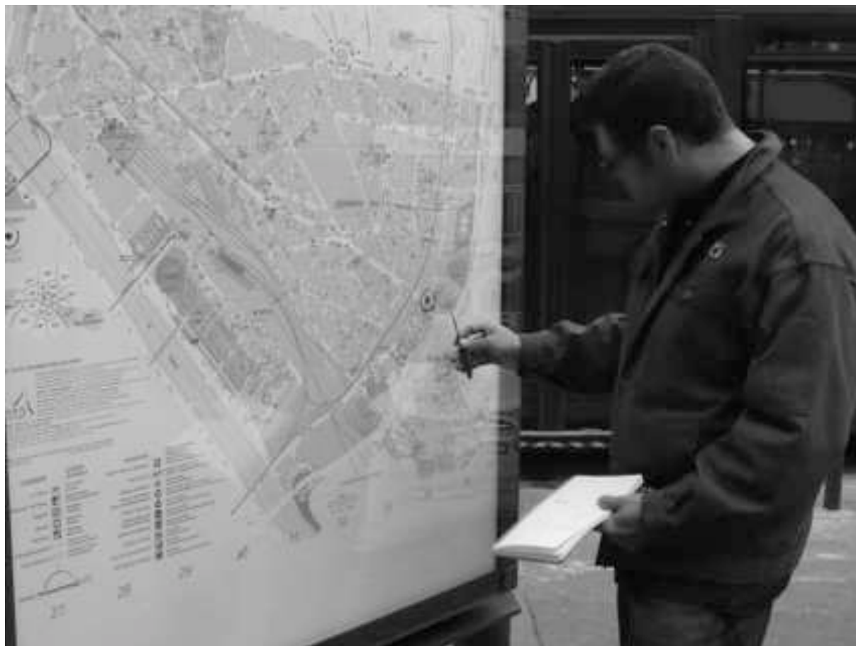
Figure 3. Prendre en compte un autre déictique

On pourrait considérer la dernière scène comme une anecdote qui témoignerait d'une erreur sans importance, corrigée sur le vif. Elle met pourtant en lumière une dimension importante de la production de déictiques graphiques. Nous avons vu à propos de la normalisation de la signalétique en système complexe de références que les indications ne fonctionnaient qu'en rapport à un réseau de déictiques standardisés. Avec cette scène, nous percevons aussi l'importance d'autres instruments indicateurs, extérieurs à la RATP. Le plan de quartier n'est pas seulement une ressource pour apaiser les doutes de Paul. Il représente aussi un autre système de déictiques avec lequel les panneaux qu'il est en train de transformer doivent s'articuler sans heurts.