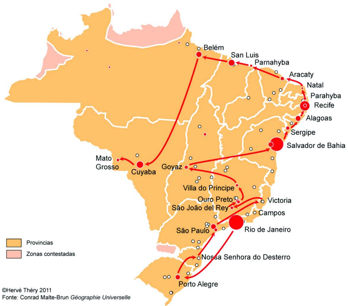
Figura 1 - O percurso da descrição regional

Como se vê, a precisão da descrição não impede certo lirismo e a expressão literária pode mesmo ser feliz na escolha das palavras. Assim, para caracterizar a topografia que qualificamos hoje de relevo “em meio-laranjas”, o autor descreve: “uma longa sequência de colinas de areia e de terra móvel, que se apresentam de longe como as ondulações do mar agitado”. Neste caso, ele prefigura o “mar de morros”, a expressão que o geógrafo brasileiro Aziz Ab’Saber utiliza para caracterizar a mesma região.