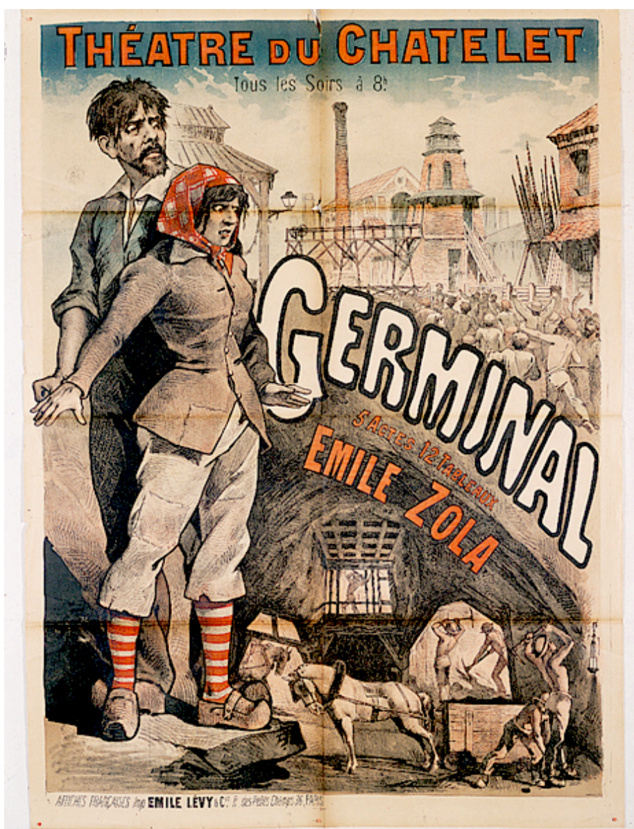
Émile Lévy, affiche de la représentation de Germinal de Zola au théâtre du Châtelet en 1888.

Je tiens à dire, avant tout, que nos fameux gendarmes, dont on a mené tant de bruit traversaient simplement la scène, au milieu des grévistes, et qu'ils ne tiraient que de la coulisse, où