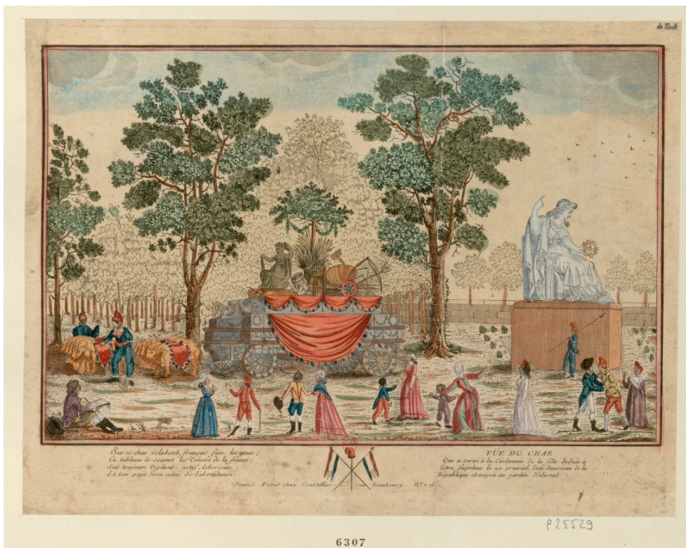
Vue du char qui a servi à la cérémonie de la fête dédiée à l'Être suprême le 20 prairial l'an deuxième de la République (8 juin 1794) et exposé au jardin national. Eau-forte, roulette, coul., 26,5 x 33,5 cm. Archives numériques de la Révolution française (université de Stanford et Bibliothèque nationale de France).

Trois exemples seront évoqués et brièvement analysés. Le premier est un événement révolutionnaire sensu stricto : les funérailles de Jean-Paul Marat. Si elles sont assimilables à