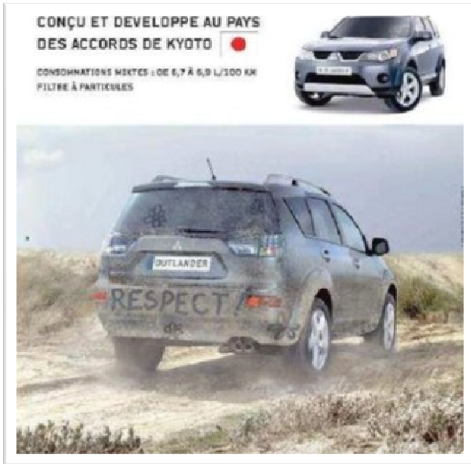
Figure 1 – Exemples de visuel mis en avant par les associations écologistes