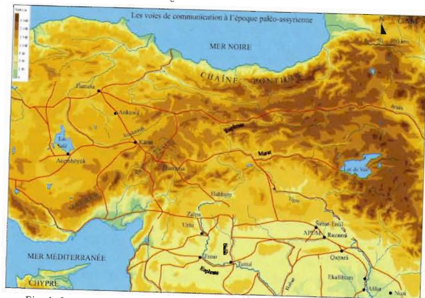
Fig. 1: Les voies de communication à l'époque paléo-assyrienne.

moyens utilisés pour accroître leurs bénéfices. Le commerce semble avoir profité à toute la population d'Aššur, voire à une partie des habitants des différentes cités-États anatoliennes, à commencer par l'élite locale. L'évolution de la situation économique de certaines familles a nécessairement des retombées sociales et les textes font état de divers signes extérieurs de richesse.