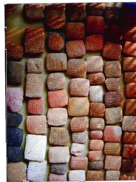
Fig. 4: Tablettes découvertes à Kaniš en 1993, archives d’Aššur-taklāku.

Néanmoins, les bénéfices réalisés chaque année par les Assyriens profitent à l’ensemble de la population de la ville, à ses temples, qui mettent des capitaux à la disposition des marchands, et à ses institutions gouvernementales, clairement impliquées dans les échanges commerciaux. À la variété des métiers commerciaux – banquiers, agents, transporteurs –, s’ajoutent ceux qui ont un lien plus ou moins direct avec les échanges à grande distance, comme les artisans du textile et du cuir (sacs et harnais), les éleveurs d’ânes, les messagers 38 ... Les éponymes d’Aššur, choisis parmi les grandes familles de la ville, mentionnés dans les textes de Kaniš et dont plusieurs listes ont été récemment identifiées 39 , exercent différents métiers qui n’ont pas tous un lien avec le commerce: batelier, fabricant d’armes, pourvoyeur de beurre, mais on y trouve aussi des éponymes tamkārûm .