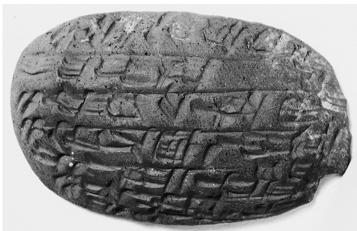
Fig. 3. Tablette Kt 93/k 55: supplément à une lettre.