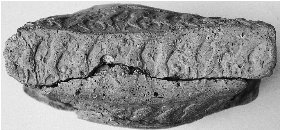
Fig. 4b. Tranche inférieure de la face, le renflement supérieur correspond au post-scriptum.