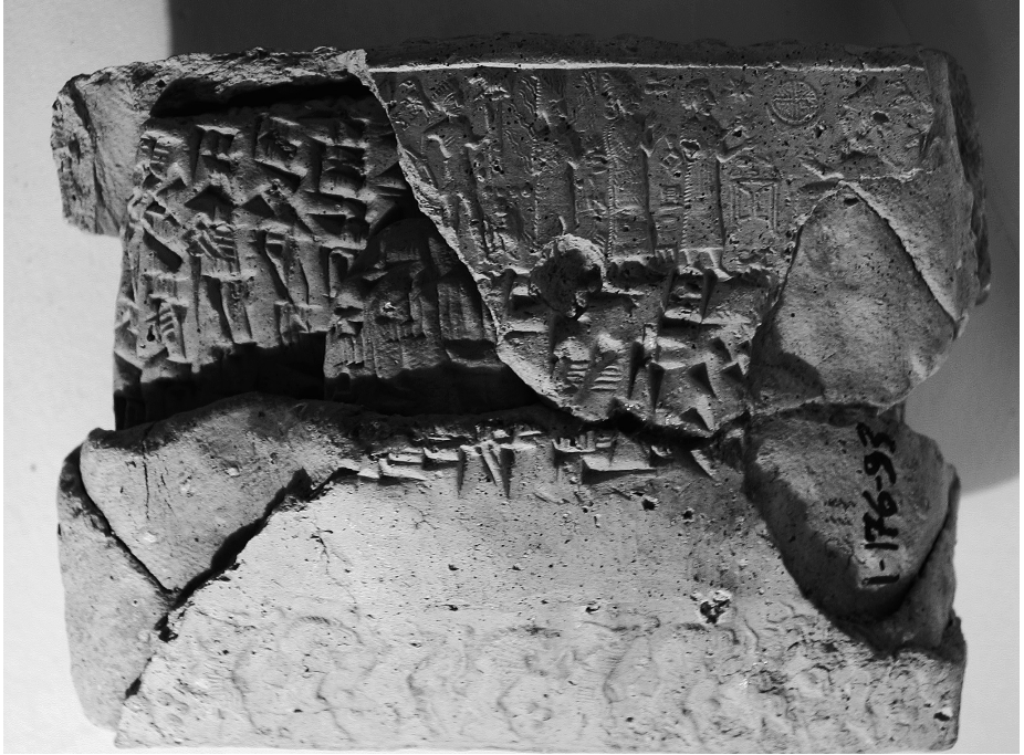
Fig. 4a. Kt 93/k 211, face : lettre dans son enveloppe adressée par Aššur-taklāku et Šamaš-abi à Abu-šalim et Amur-Ištar. La tablette comprend 32 lignes, le post-scriptum en 4. L'enveloppe comporte les sceaux des expéditeurs.