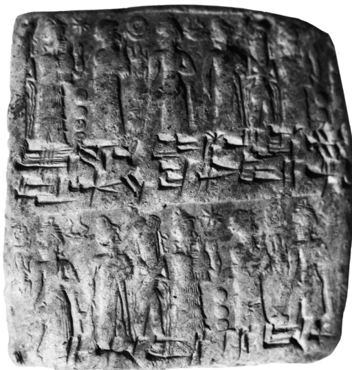
Fig. 2. Revers de l'enveloppe TPAK 1 62.